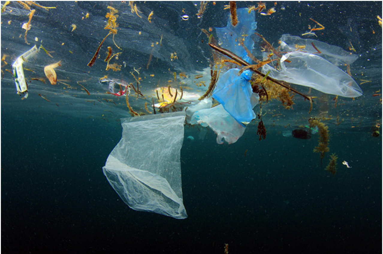
Plastic ocean pollution – plastic bag and rubbish floating in ocean.