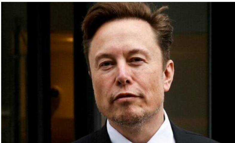
Tesla CEO Elon Musk departs the company's local office in Washington, on Jan. 27, 2023.