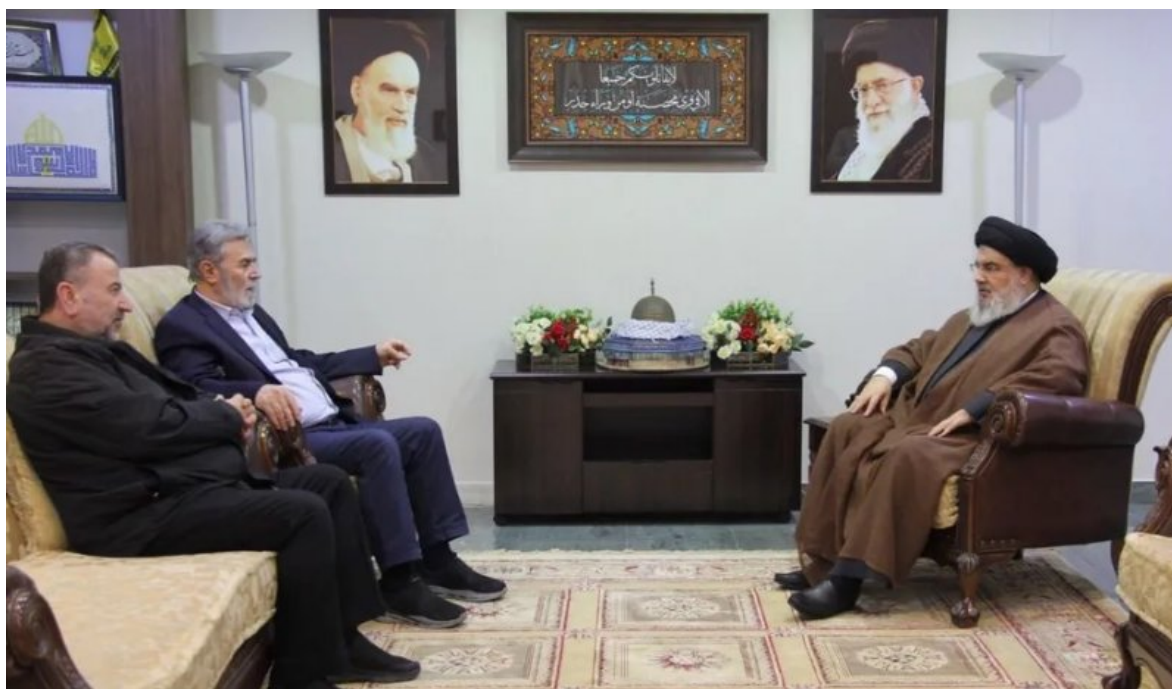
Il segretario generale di Hezbollah, Hassan Nasrallah, ha ricevuto il numero due di Hamas, Saleh el-Arouri, e il leader della Jihad islamica, Ziad el-Nakhala.

Per il momento il conflitto è limitato alla Striscia di Gaza. I palestinesi in Cisgiordania e in Israele non si sono ribellati. E nemmeno i rifugiati provenienti dalla Giordania e dal Libano. Hezbollah è stato fermato dalla risoluzione 1701 firmata dai suoi ministri alla fine della guerra israelo-libanese del 2006 [ 2 ] . Non può attraversare il fiume Litani ed entrare nel territorio israeliano senza venire meno alla sua parola, che, a differenza degli occidentali, per lui è importante. Questo impegno non sarà più valido se Israele attacca il Libano. Quindi per il momento Hezbollah sta a guardare e sta distruggendo una dopo l'altra le telecamere di sorveglianza e i radar israeliani lungo il confine. In questo modo potrà cogliere di sorpresa l'esercito israeliano qualora decidesse di entrare in guerra.