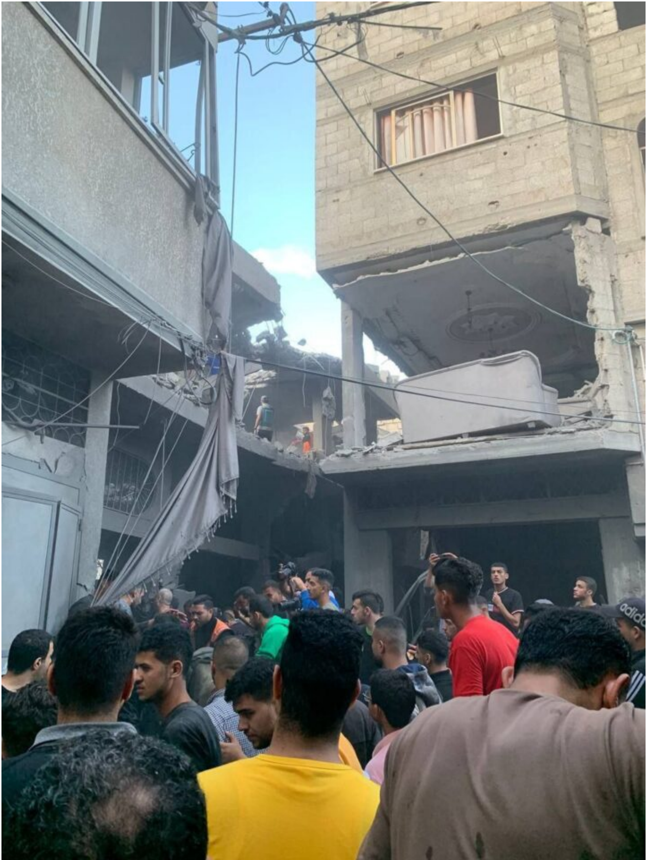
Aerei israeliani hanno preso di mira due case delle famiglie Al-Agha e Ashur nel centro di Khan Yunis, provocando diversi morti e feriti.