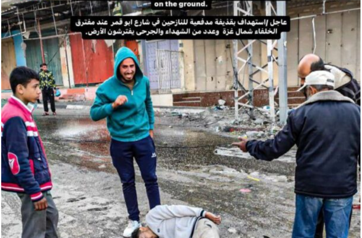
عاجل / استهداف بقذيفة مدفعية للنازحين في شارع ابو قمر عند مفترق الخلفاء شمال غزة وعدد من الشهداء والجرحى يفتشون الأرض.