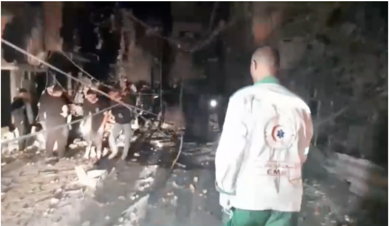
Due bambini sono stati uccisi e diversi civili feriti in un attacco israeliano contro un edificio residenziale nelle vicinanze dell'ospedale Abu Yousif Al Najjar, nella parte orientale di Rafah.