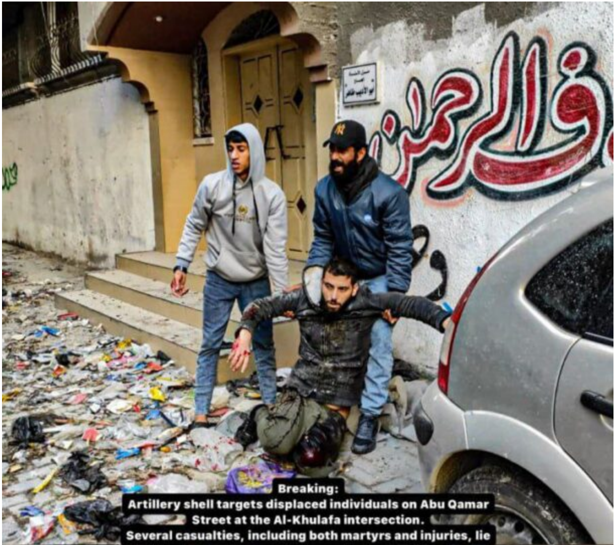
Breaking: Artillery shell targets displaced individuals on Abu Qamar Street at the Al-Khulafa intersection. Several casualties, including both martyrs and injuries, lie on the ground.