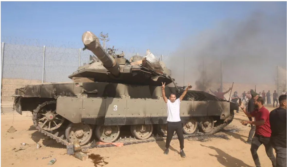
Hamas' Victory Is an Israeli Failure on a Massive Scale Amos Harel / Analysis