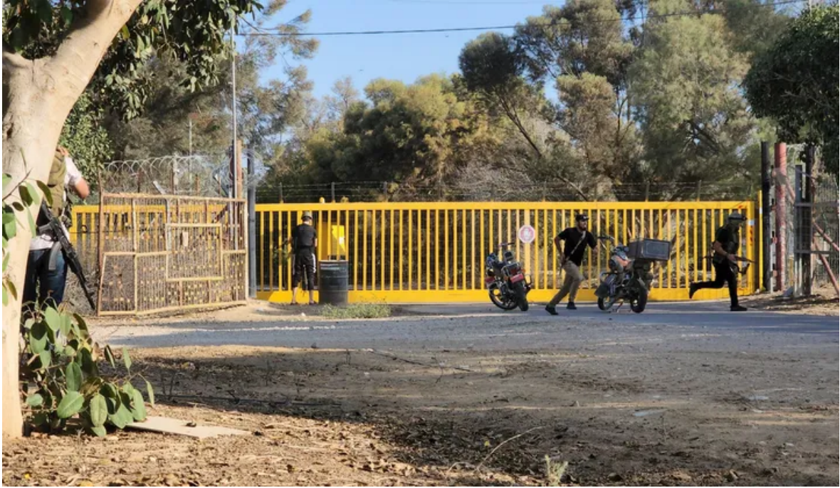
Eyewitnesses Recount Horrors Following Gazan Infiltration to Southern Israel Josh Breiner