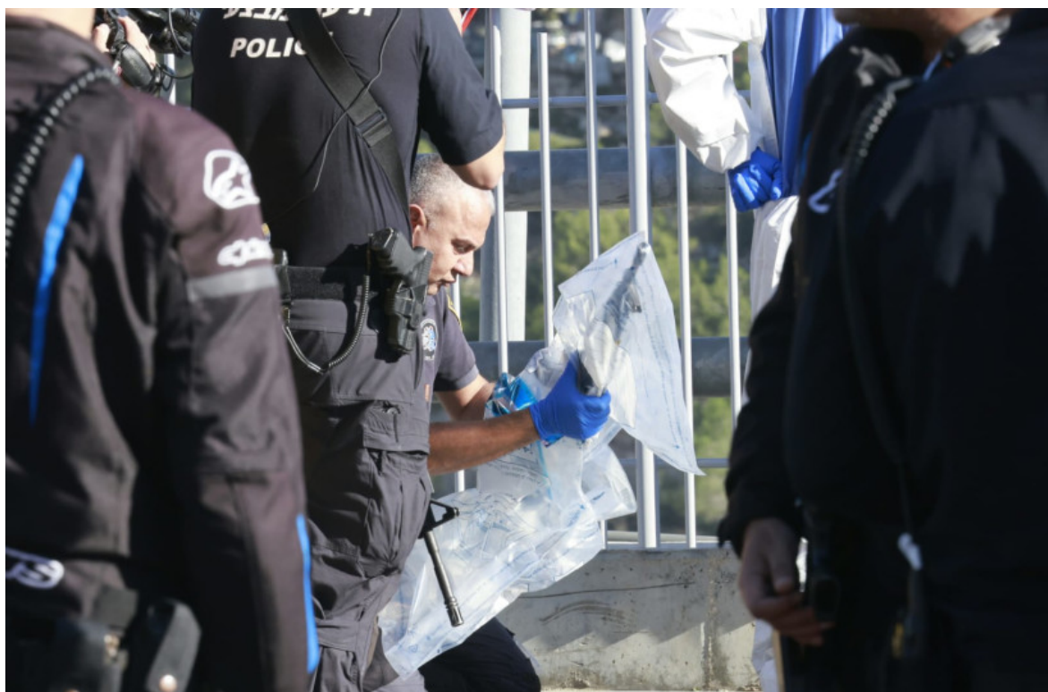
La polizia sulla scena di una sparatoria a Gerusalemme. 30 novembre 2023

I due terroristi sono stati uccisi dalle forze di sicurezza e da un civile che era sul posto, compreso un soldato dell'IDF che stava tornando alla base dopo aver preso una pausa dal servizio a Gaza.