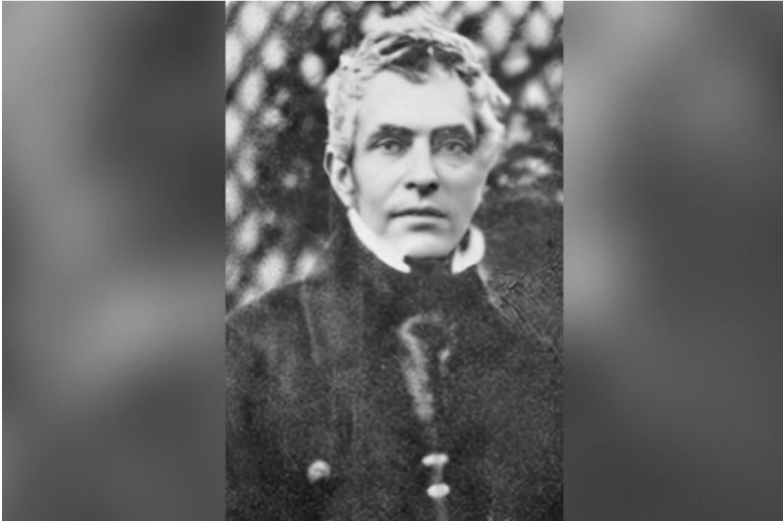
John Nelson Darby

Russell nel 1891 scrisse una lettera a un membro della famiglia di banchieri Rothschild, Edmond de Rothschild , e a Maurice von Hirsch , un ricco finanziere tedesco di origine ebraica, riguardo al suo piano per colonizzare la Palestina. Ha descritto il suo piano come segue: “La mia proposta è che gli ebrei ricchi comprino dalla Turchia al giusto valore tutti i suoi diritti di proprietà su queste terre: cioè tutte le terre statali (terre non possedute da proprietari privati), a condizione che Siria e Palestina saranno costituiti come Stati liberi .”