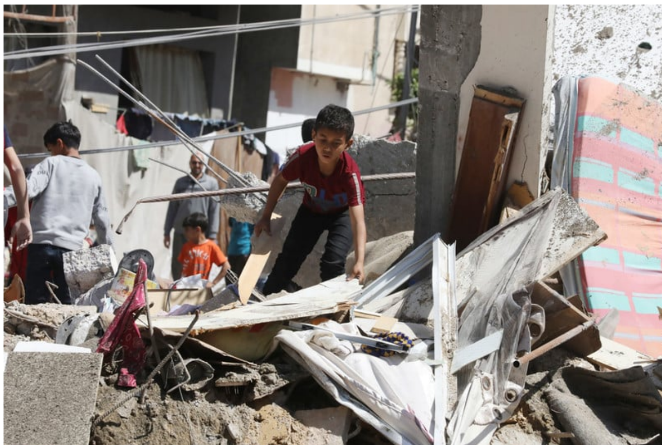
La tristezza dei bambini è palpabile.

Eman Alhaj Ali L'Intifada Elettronica 12 aprile 2024