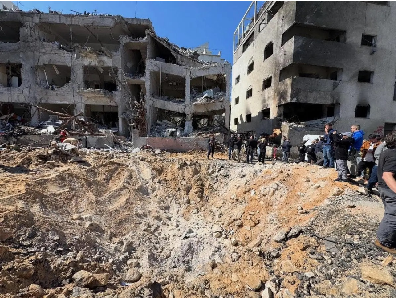
Conseguenze dell'attacco iraniano a Tel Aviv, 28 febbraio.

La guerra sionista-americana contro l'Iran è quindi diventata “una gara di resistenza”, in cui “il vantaggio decisivo passa all'attore in grado di sostenere la propria economia difensiva e rifornire le proprie risorse più critiche”. Sulla base delle attuali tendenze belliche, la Repubblica Islamica detiene saldamente tale vantaggio e continuerà a farlo. Gli Stati Uniti potrebbero rimanere senza missili da attacco al suolo – inclusi i tanto decantati ATACM – e intercettori THAAD nel giro di poche settimane. Analogamente, il RUSI prevede che gli intercettori Arrow israeliani saranno “probabilmente” “completamente esauriti” entro aprile.