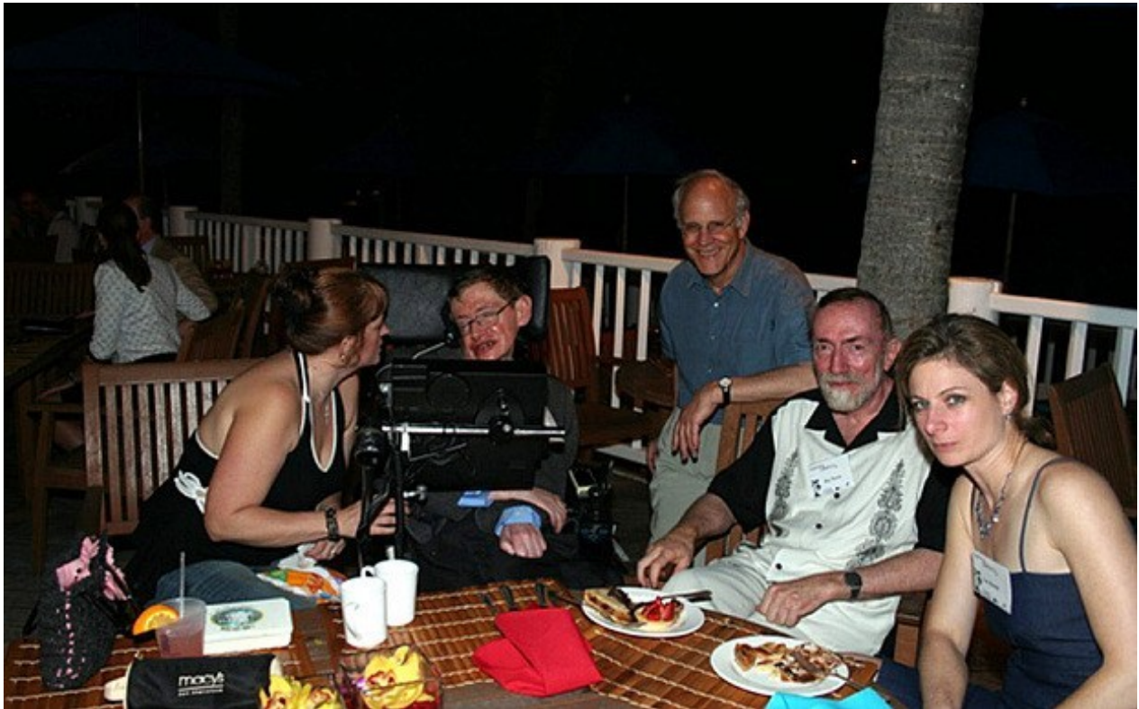
Il fisico Hawking ospite di Epstein (2006).

In attesa che altre pentole del diavolo si scoperchino (o del deep state) un lancinante episodio: nel gennaio 2015, il Telegraph ha pubblicato foto del professor Stehen Hawkins, il grande fisico in sedia a rotelle, nell'isola di Epstein – dove lo scienziato deforme ha trascorso una notte di sesso, si dice, con una dodicenne. Epstein aveva organizzato un convegno sulla gravità, invitando a sue spese 21 scienziati di fama internazionale all'hotel Ritz Carlton nell'isola di Sainth Thomas, vicina alla sua isola privata