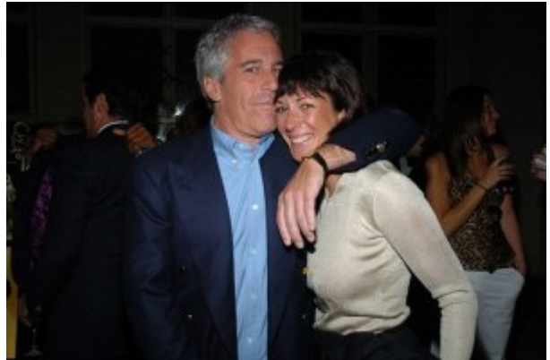
Oggi “madame” del pedo. Per ricattare insieme.