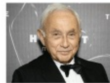
Leslie Wexner

One of sex offender Jeffrey Epstein's accusers claimed to have been assaulted in the home of billionaire Leslie Wexner, The Daily Beast reported.