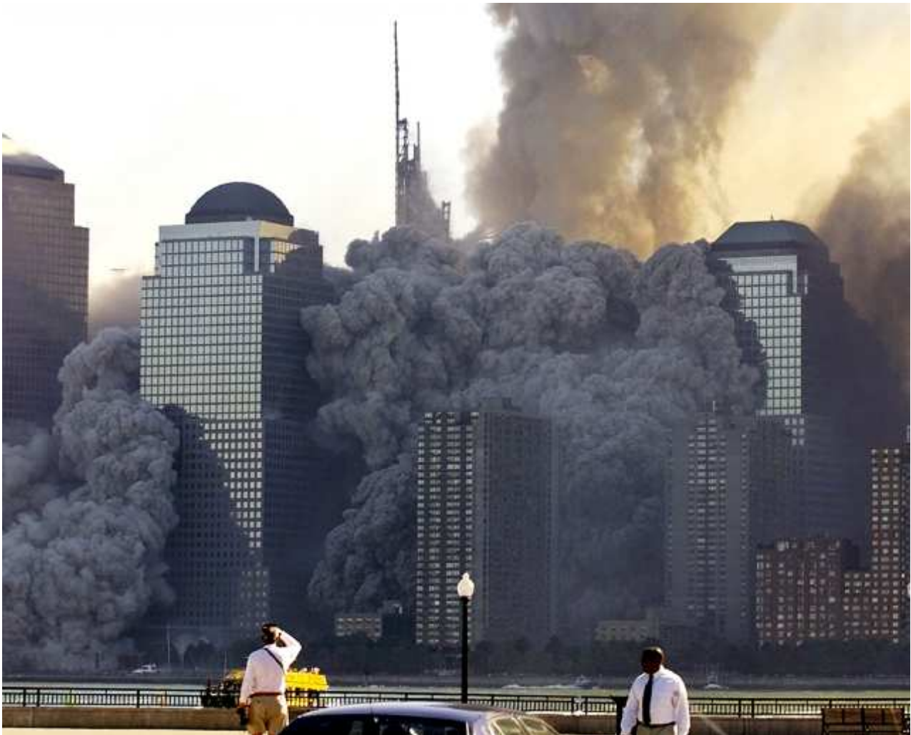
New York's World Trade Center September 11, 2001.

La stragrande maggioranza si riferisce agli avvistamenti del 2 ° evento al WTC2 mentre sorprendentemente pochi si riferiscono al 1 ° evento al WTC1. Con questo in mente e permettendo che i rapporti dei testimoni possano essere una fonte affidabile di informazioni – dovremmo concentrarci sui rapporti dei testimoni disponibili.