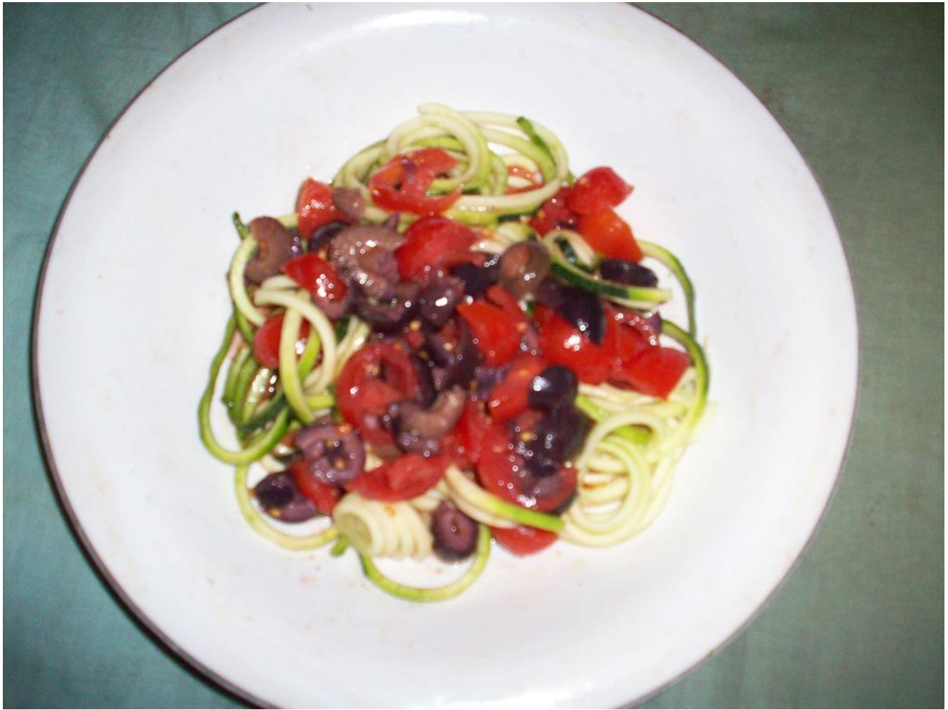
Spaghetti fruttariani con pezzetti di pomodorini, di olive nere e verdi, e olio d'oliva