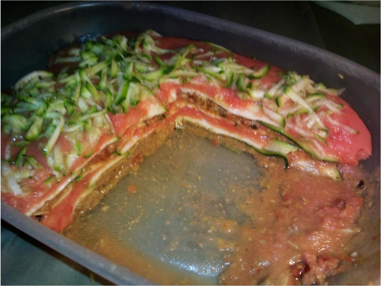
Teglia di lasagne fruttariane