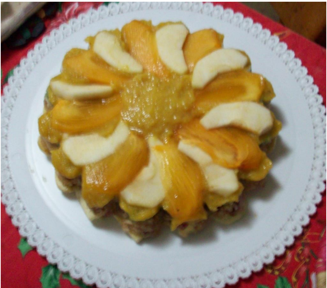
Torta di mele fruttariana (con variante di copertura alternata al kaki)

5) copertura di mele a fettine leggermente accavallate disposte sul bordo a raggiera, con al centro qualche fragola a metà e qualche mirtillo];