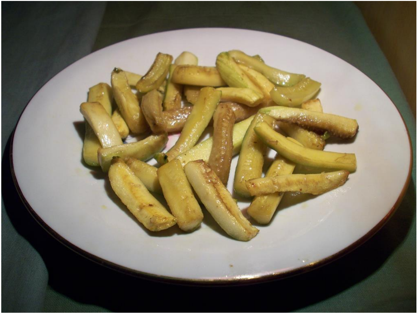
Patatine fritte fruttariane (strette e lunghe)