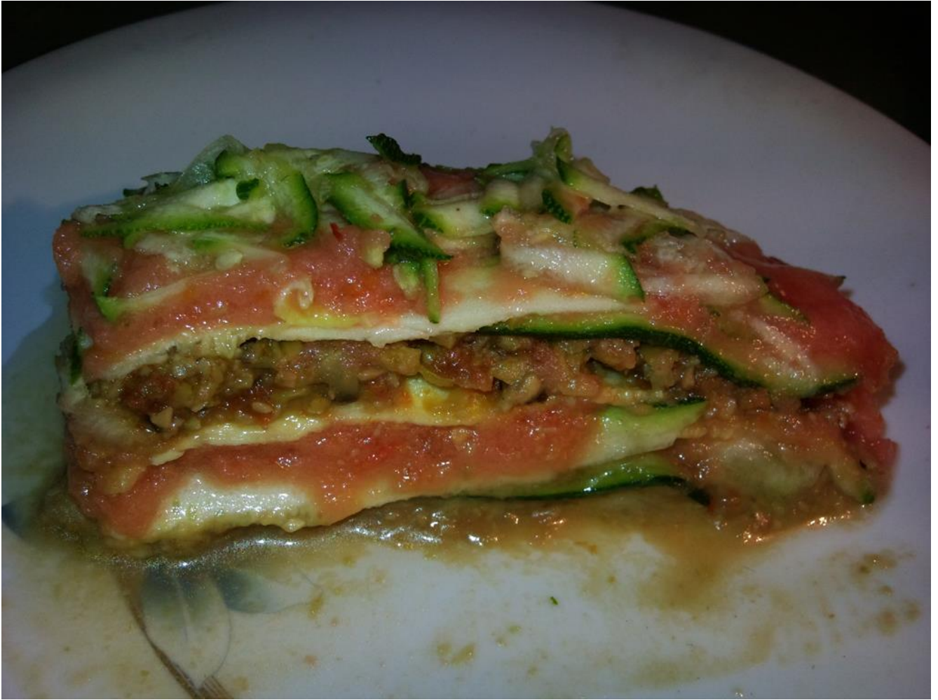
Trancio di lasagna fruttariana