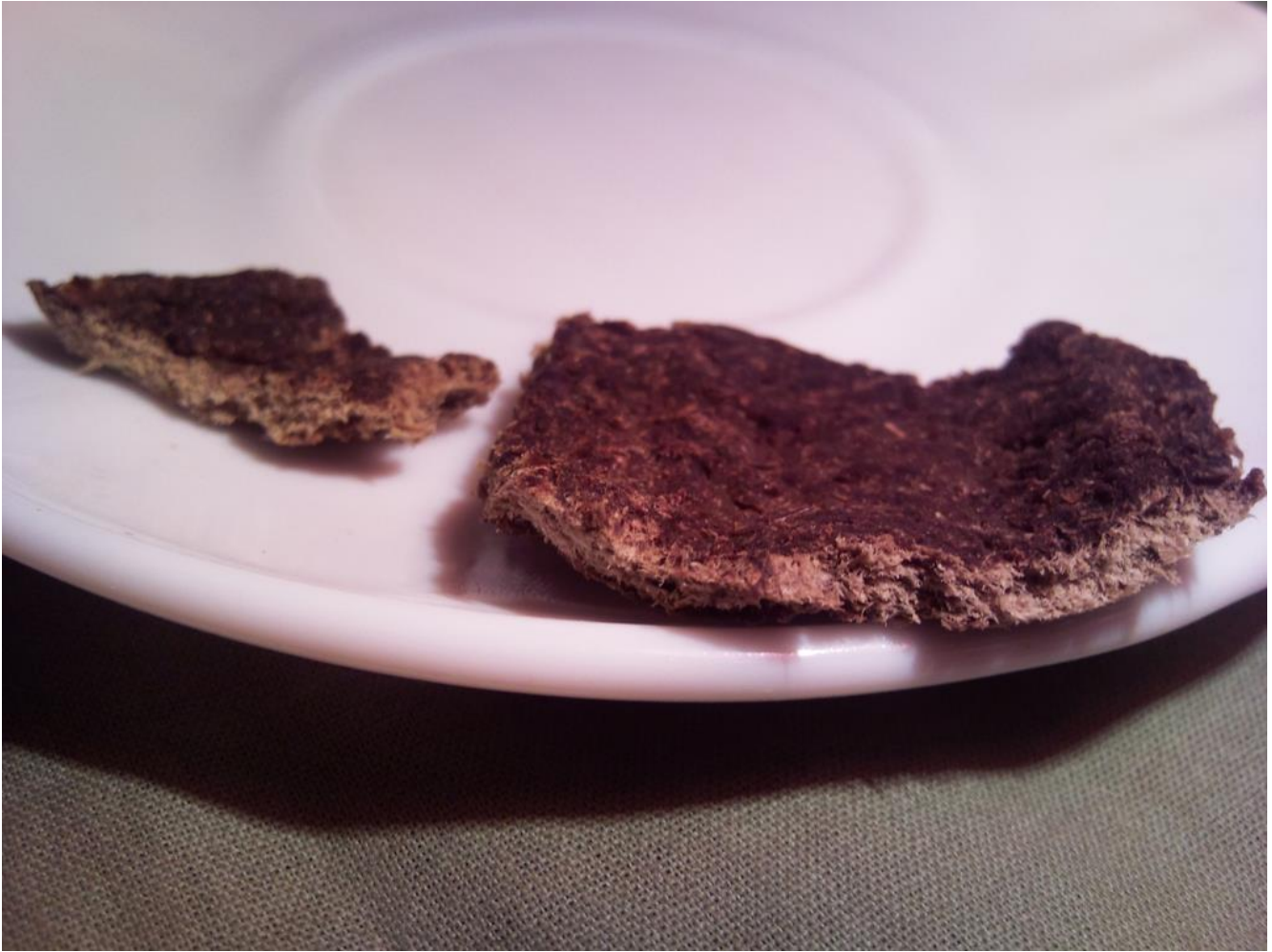
Pane fruttariano (integrale)