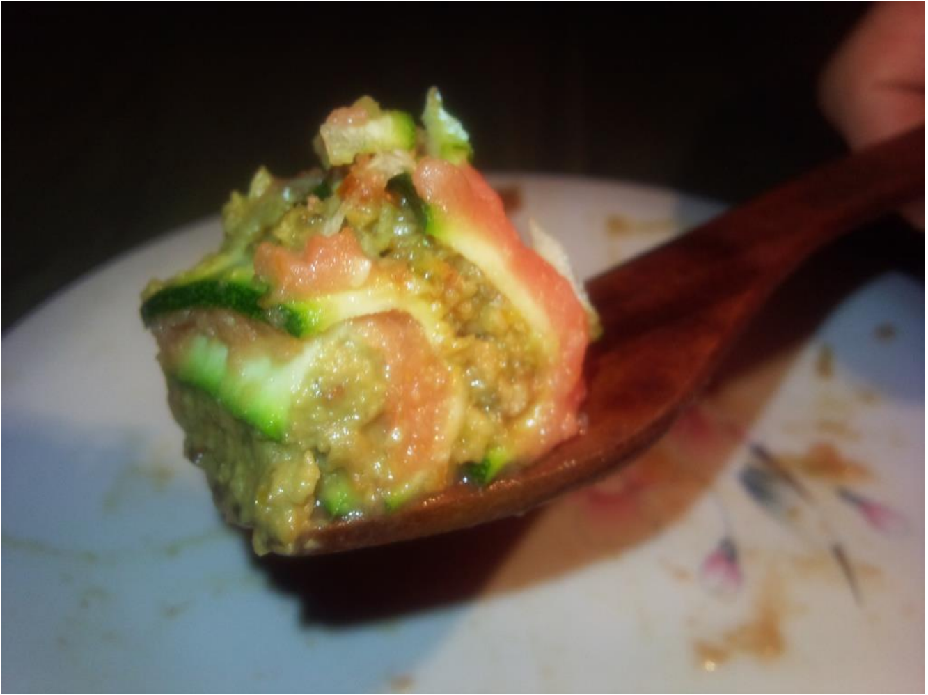
Boccone di lasagna fruttariana