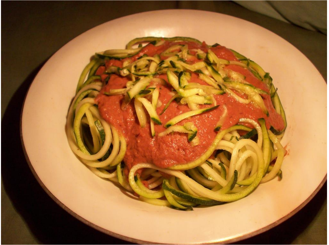
Spaghetti fruttariani con sugo alle olive