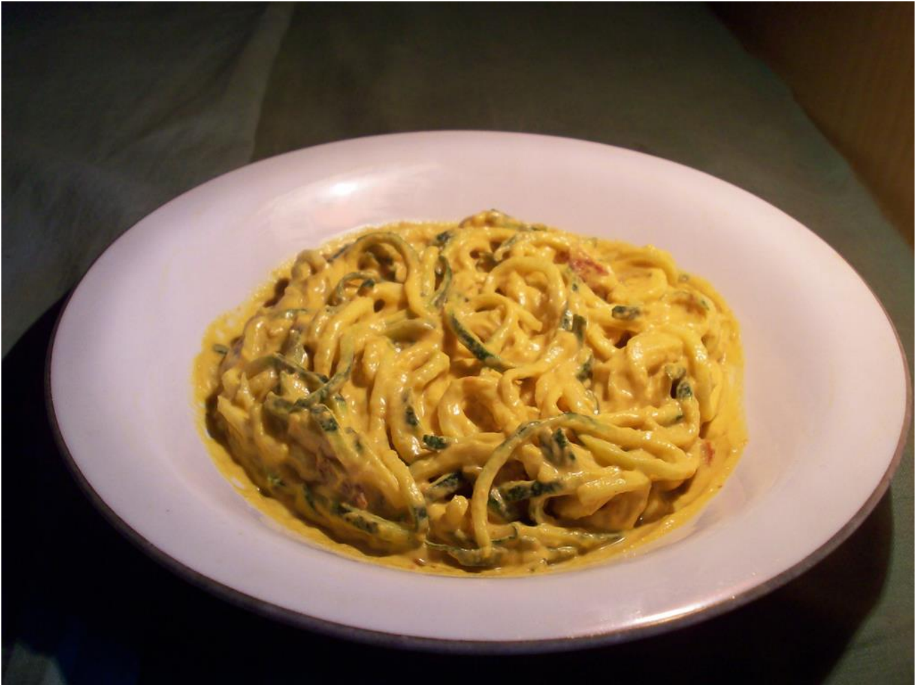
Spaghetti alla carbonara fruttariani