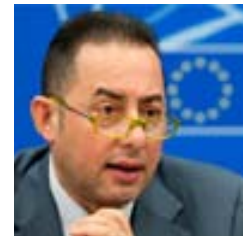
Gianni Pittella Premier Vice-président du Parlement européen