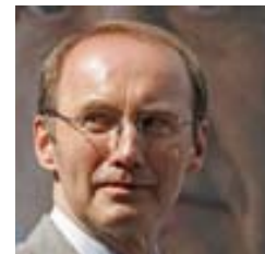
Othmar Karas Vice-président du Parlement européen