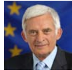
Jerzy Buzek Ancien Président du Parlement européen