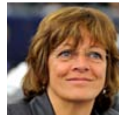
Isabelle Durant Vice-présidente du Parlement européen