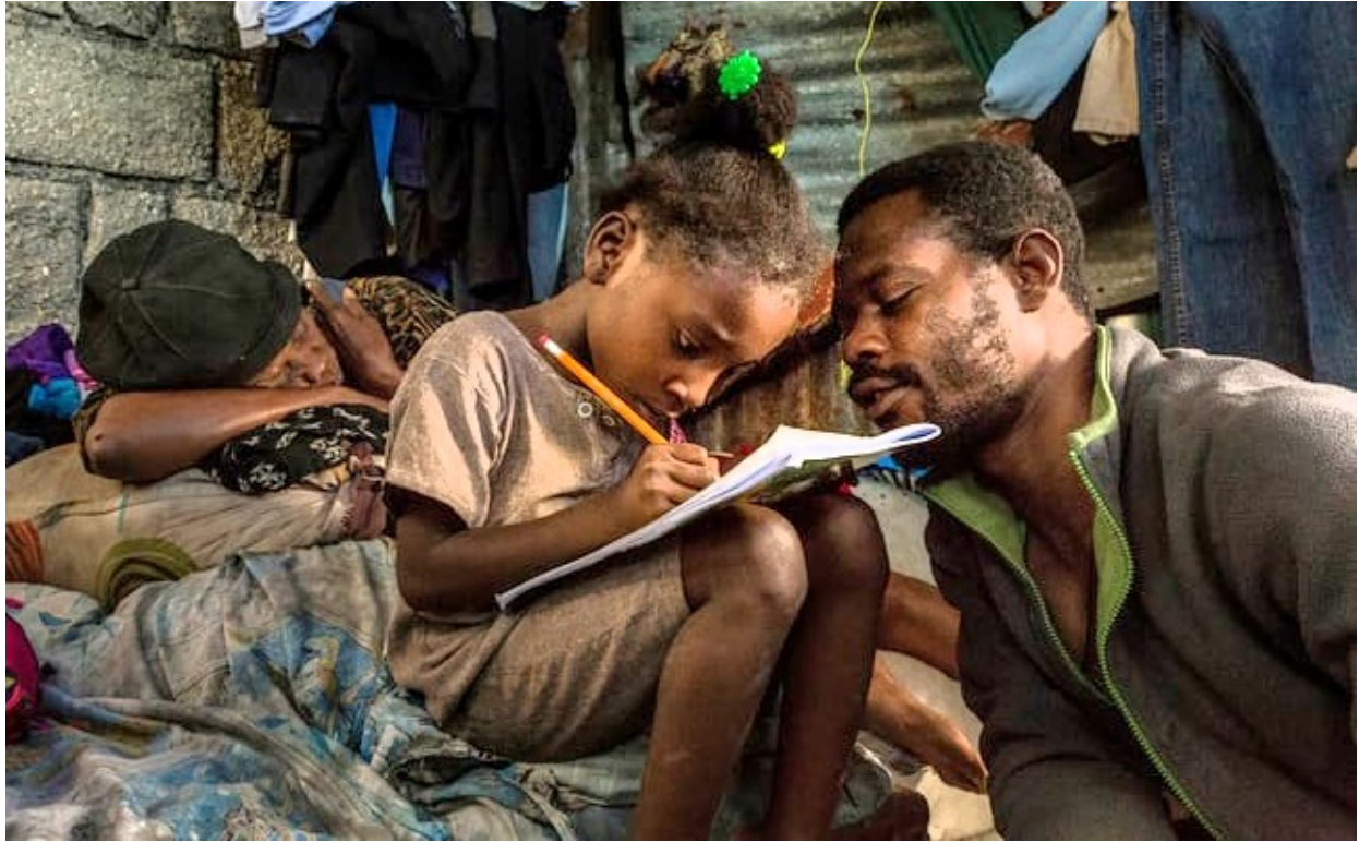
Il servizio fotografico e il reportage su Haiti sono stati pubblicati dal Guardian (Dignità, comunità e speranza nella baraccopoli haitiana di Jalousie)