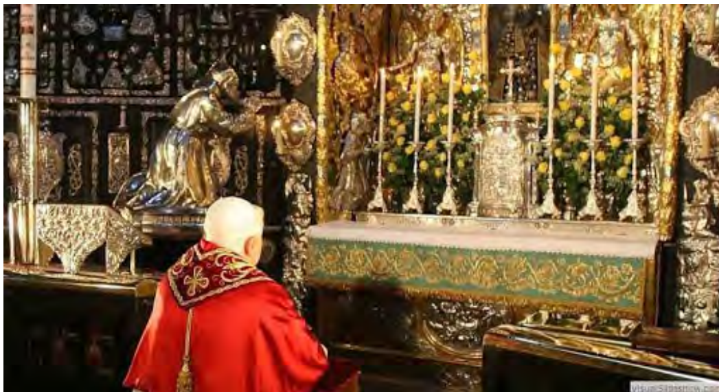
Ratzinger in preghiera

Un articolo del 1952: "Posso dirlo esattamente: tutte le persone che vivono intorno a un luogo sacro sono risparmiate, non si torce un capello il cielo lo assicura. Mi ha detto che c'è anche una grande chiesa di pellegrinaggio laggiù a Pfaffenwinkel tra Lech e Ammer, dove le persone pregano il Signore flagellato. Certamente non succede nulla lì. Verranno solo i rifugiati ..."