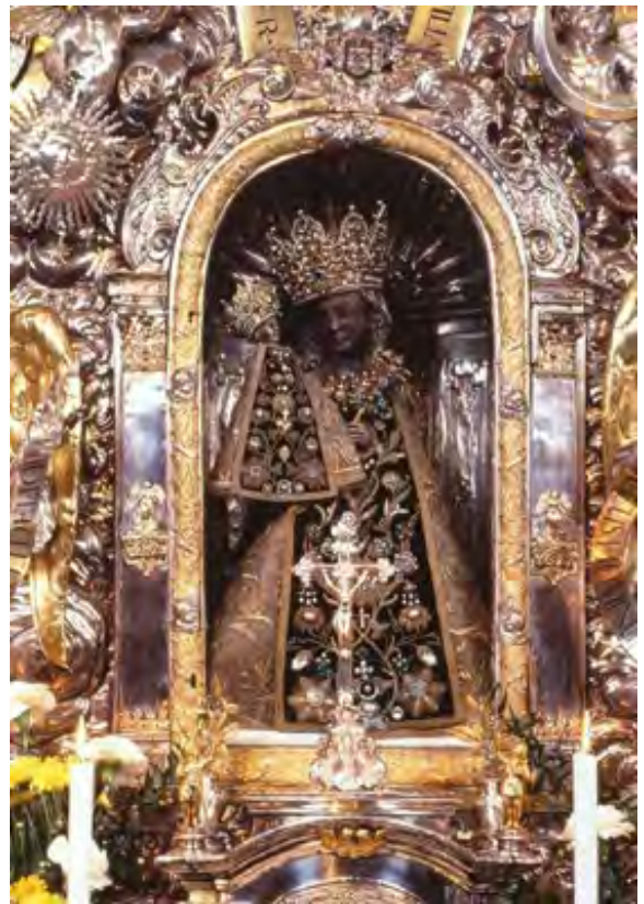
La Vergine Nera di Altoetting, grande protettrice della Baviera-