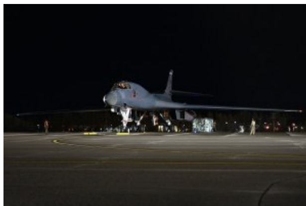
Uno dei B-1 allo scalo in Alaska.

I tre Lanciers, assegnati al 345th Bomb Squadron presso la base aerea di Dyess ad Abilene, in Texas, hanno dimostrato come i bombardieri strategici statunitensi siano in grado di supportare qualsiasi missione, ovunque nel mondo, in un baleno. La missione, che ha completato il dispiegamento di sei B-52 alla RAF Fairford in Inghilterra, ha mostrato come le risorse con sede negli Stati Uniti possano essere impiegate per raggiungere un obiettivo operativo sui fianchi orientale e occidentale di USEUCOM. [...] Questo volo continuo di 14 ore e 4.300 miglia nautiche ha segnato anche la prima volta che una missione europea BTF è stata supportata da un'unità B-1 Lancer della US Air Force Reserve, portando così avanti gli sforzi di integrazione totale delle forze.