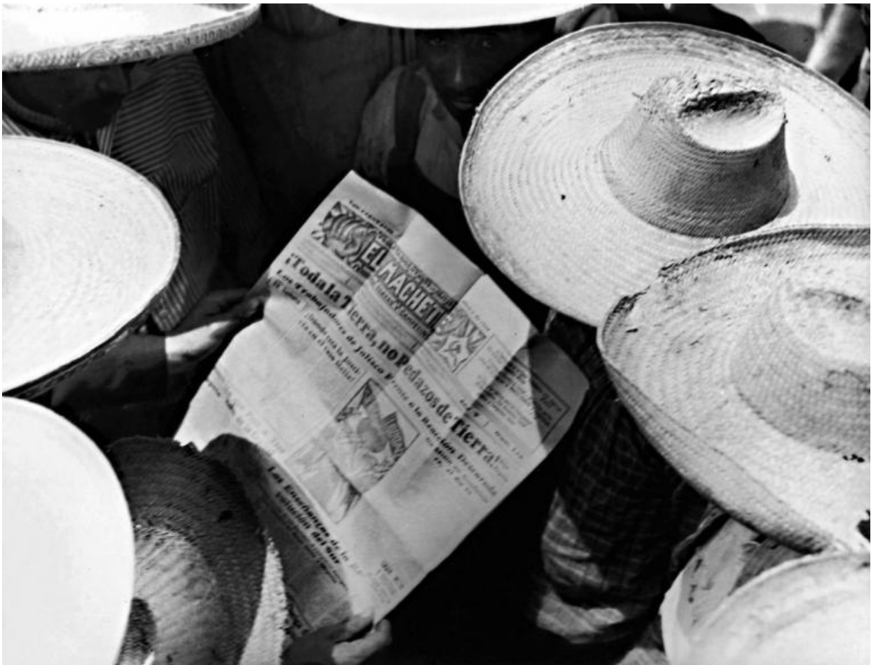
Tina Modotti, Contadini che leggono «El Machete», 1927, Messico © Tina Modotti.

La luce crea la profondità di uno spazio che colloca la fotografa dentro lo stesso spazio fotografato, quasi a dividerne il destino. La passione sociale e civile si fa politica, ma non in forme fredde ed esteriori, bensì in quelle della condivisione di mezzi e fini.