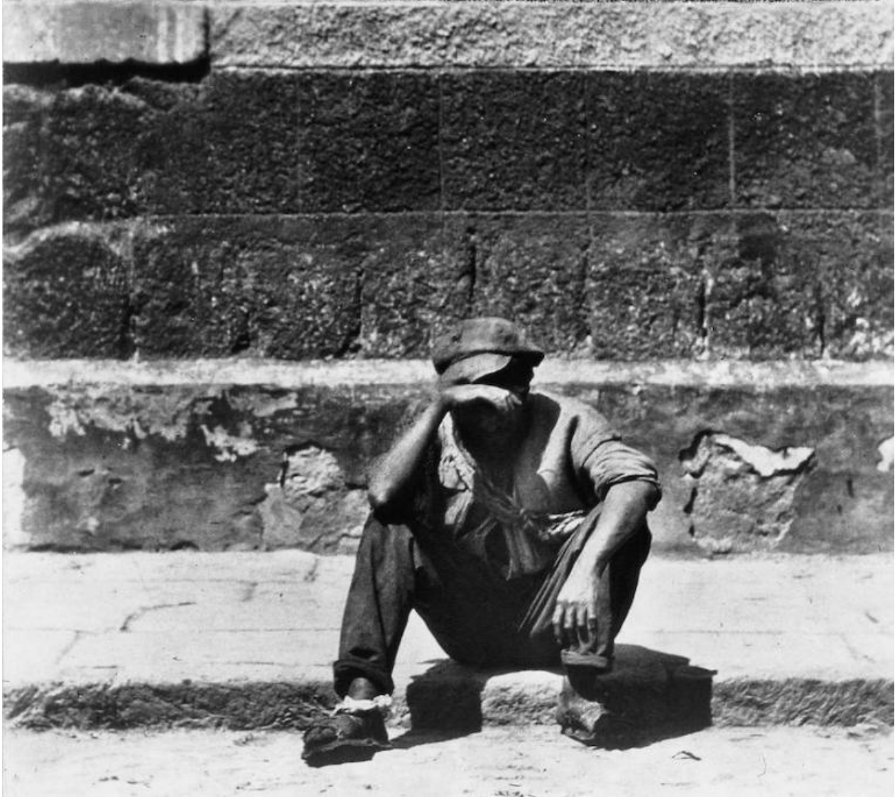
Tina Modotti, Eleganza e povertà (fotomontaggio), 1928, Messico © Tina Modotti.