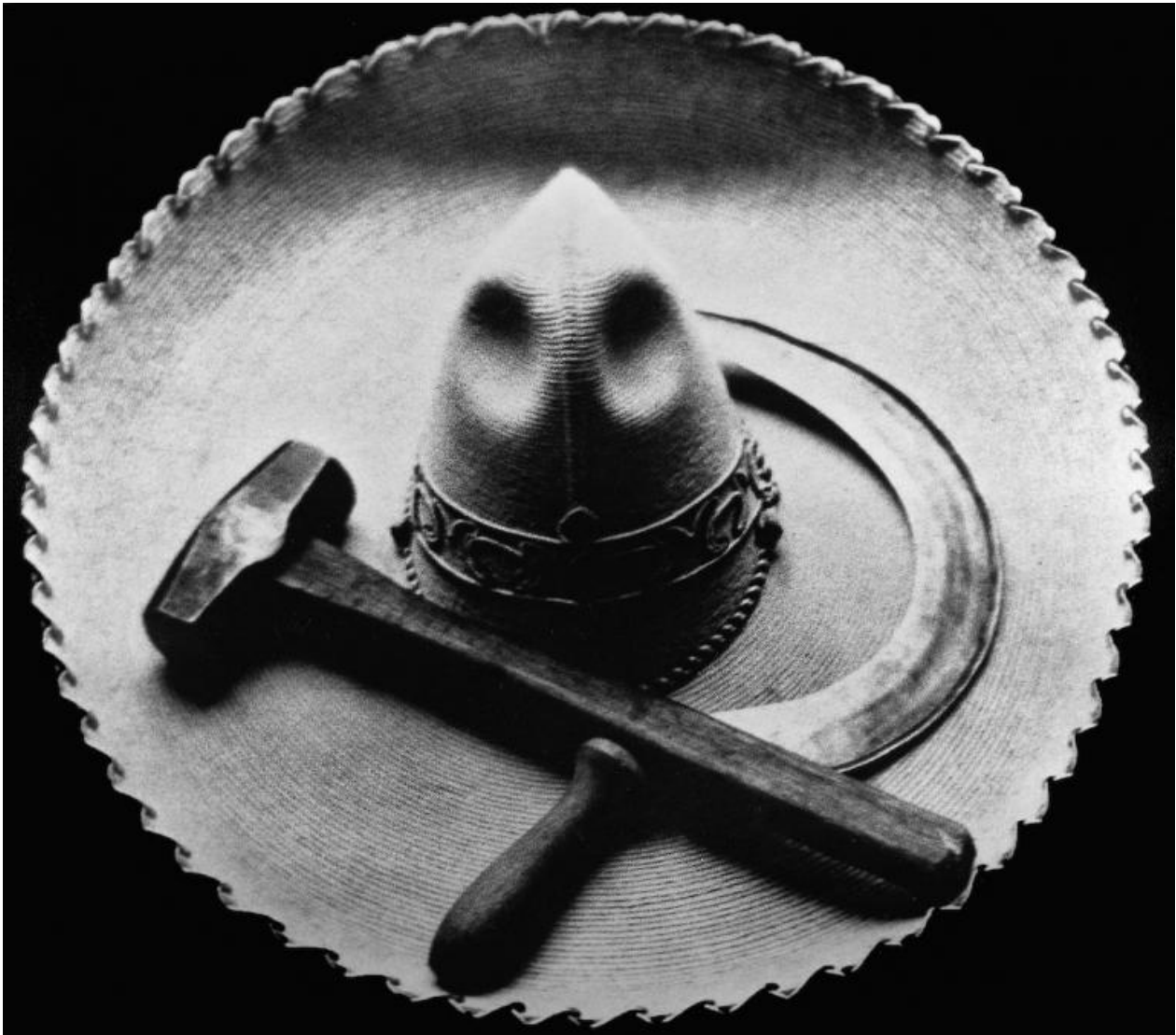
Tina Modotti, Sombrero, falce e martello, 1927, Messico © Tina Modotti.

La Modotti è immersa, con passione di idee e di sentimenti, in questo clima effervescente ed eterodosso: conosce Xavier Guerrero e se ne innamora, conosce Juan Antonio Mella e se ne innamora. La morte di quest'ultimo, avvenuta nel 1929, in circostanze mai chiarite, le provoca un'enorme sofferenza che riesce a testimoniare con un drammatico ritratto dell'amato morto, in ospedale, e con la foto della sua eredità intellettuale, un testo di Trockij sull'arte, battuto sulla sua macchina per scrivere.