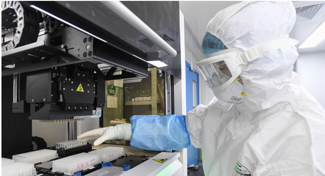
Bio-laboratori sperimentali USA

E cosa abbiamo? Problemi con il monitoraggio del funzionamento di tali oggetti. E come non ricordare i focolai di infezioni pericolose nelle regioni in cui si trovavano i laboratori biologici americani? Non è stato a lungo un segreto che l'esercito degli Stati Uniti produce tossine mortali, batteri e virus e in violazione della Convenzione delle Nazioni Unite, che vieta la produzione di armi biologiche.