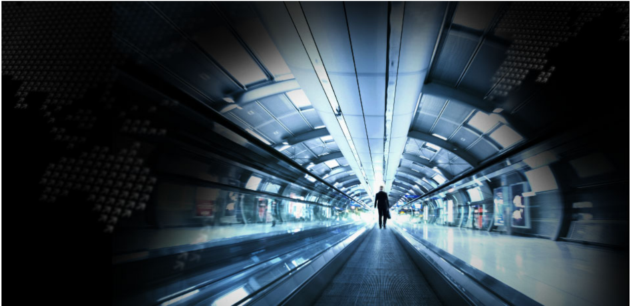
Intelligence agenti in incognito

Inoltre, se ti chiedi se sia credibile che l'FSB abbia salvato Lukashenko, ti ricorderò che sono stati i russi a salvare Erdogan da un colpo di stato appoggiato dagli Stati Uniti che avrebbe dovuto includere anche l'omicidio di Erdogan (i turchi lo hanno praticamente ammesso pubblicamente più volte).