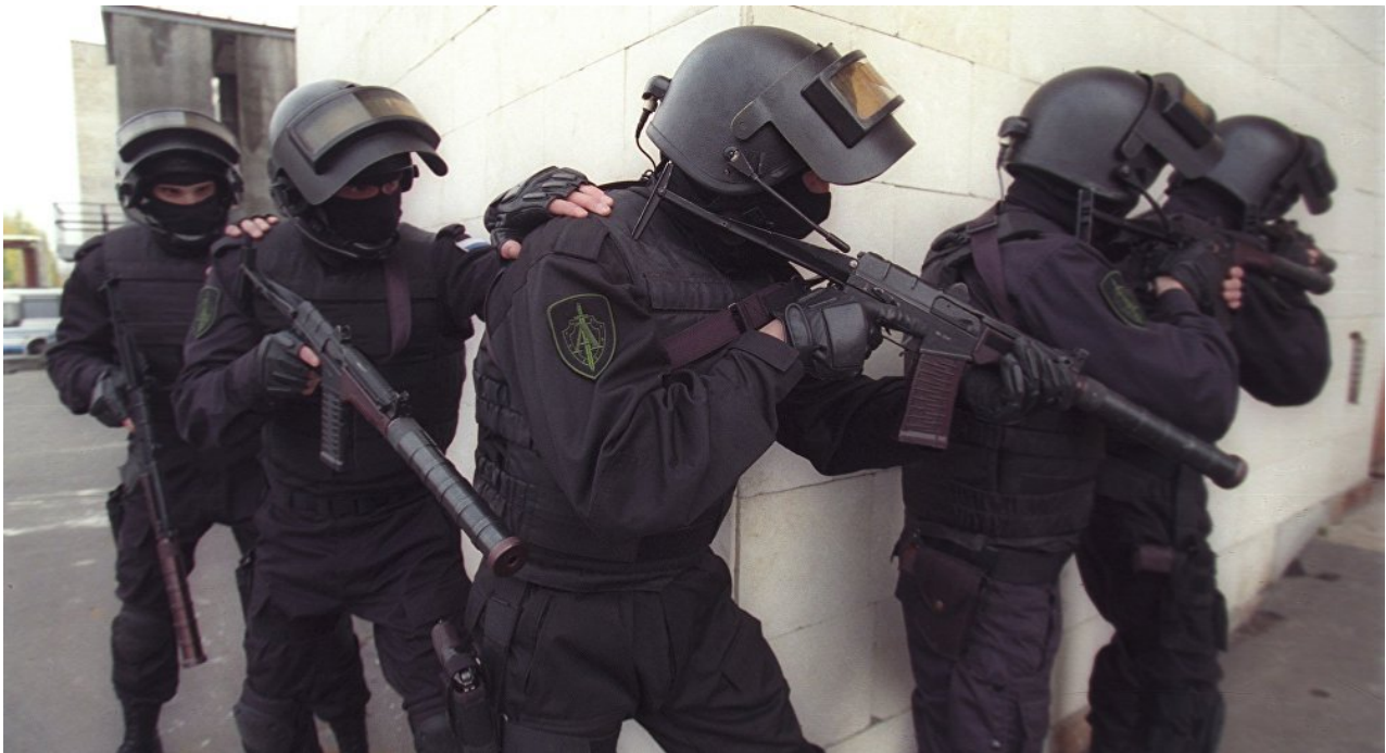
Servizio di Sicurezza Russo (FSB)