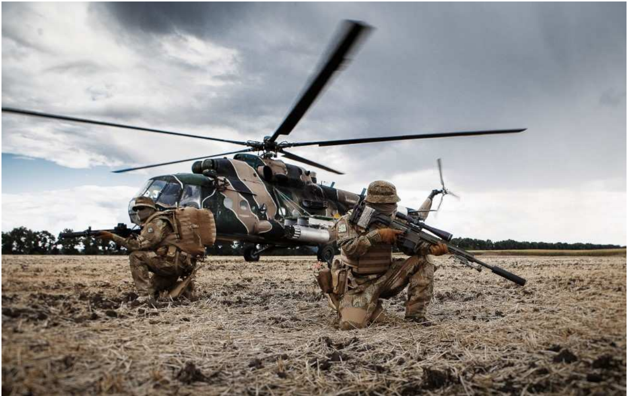
Forze difesa russa

Né esclude che il corso della guerra possa cambiare in modo tale che anche molte delle regioni ucraine che gravitano maggiormente verso la Russia siano richieste dalla Federazione Russa.