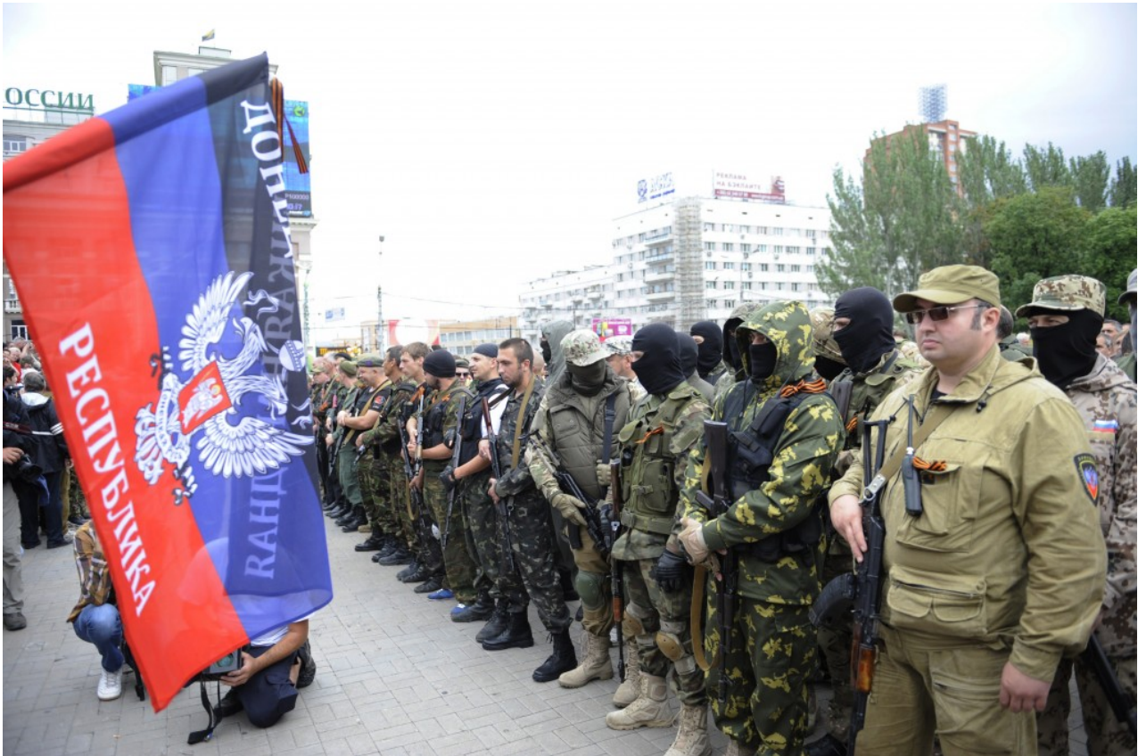
Volontari nel Donbass

“Sia l’Ucraina che gli Stati Uniti tengono conto del fatto che le truppe del distretto militare meridionale russo, al confine con l’Ucraina, sono in un costante stato di” riscaldamento “? Gli esercizi si svolgono regolarmente lì. I comandanti conoscono bene il terreno su entrambi i lati del confine e l’intelligence: lo stato delle truppe ucraine, il loro dispiegamento e le capacità ”, dice l’osservatore.