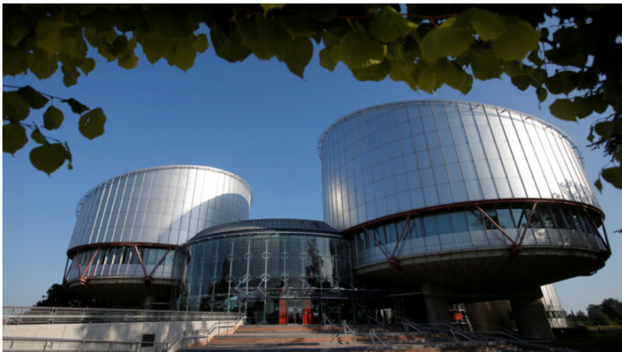
La Corte Europea dei Diritti Umani a Strasburgo

«Qualcosa non sembra proprio tornare. Fino a quando, cioè, leggerai l'articolo 8 della Convenzione europea dei diritti dell'uomo, che riguarda il diritto alla vita privata. Perché in realtà mina l'intera idea di privacy con l'inclusione di una piccola parola: "eccetto"» ha commentato l'opinionista di Russia Today, Damian Wilson, giornalista britannico, ex redattore di Fleet Street, consulente del settore finanziario e consulente speciale per le comunicazioni politiche nel Regno Unito e nell'UE..