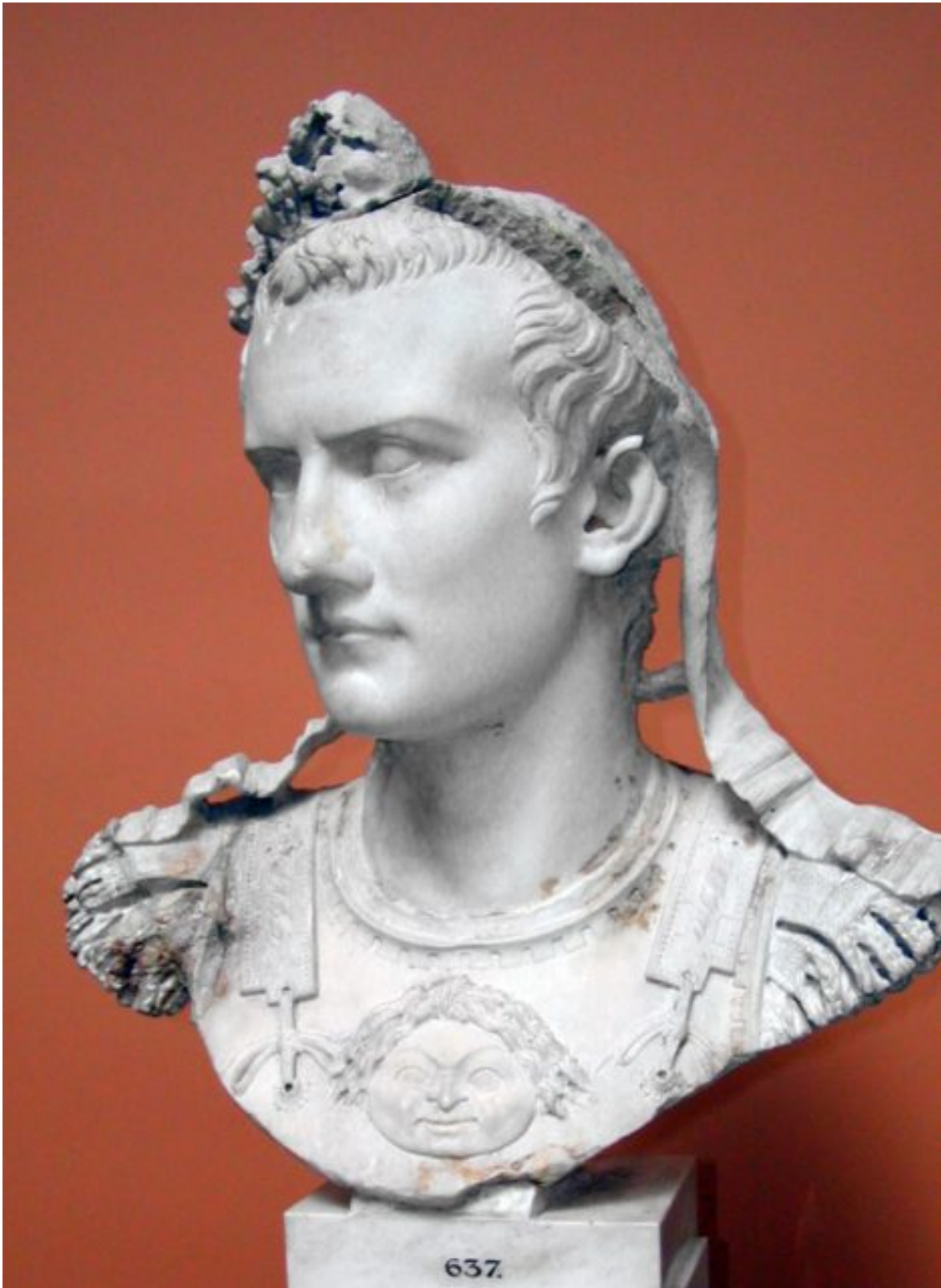
The Emperor Caligula – not the world’s greatest ever leader, although probably a lot better than Joe Biden’s going to be.

Tomorrow’s swearing-in won’t be the end of the story by a long, long chalk, so long a chalk in fact you could reach the blackboard from the back of the classroom with it. There’s bound to be litigation over betting on the election, either from punters like myself who put money on President Trump in good faith, or where defrauded betting companies refuse to pay out. I repeat that no betting company is obliged to pay out on a rigged election.