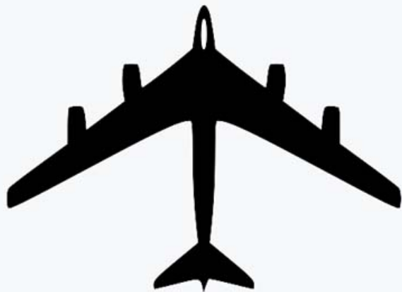
4: Modello 464-49