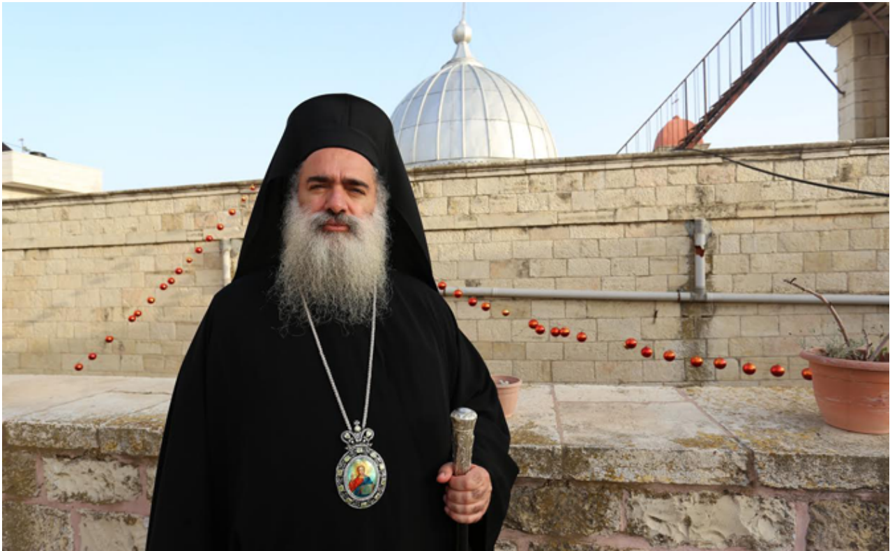
Vescovo di Gerusalemme Mons. Atallah Hanna

Ha continuato: “Non siamo neutrali riguardo alla questione palestinese, e riguardo a Gerusalemme in particolare, difendiamo questa causa, e difendiamo Gerusalemme, perché quando difendiamo questa giusta causa e quando difendiamo Gerusalemme, stiamo difendendo la nostra la storia, la nostra fede, le nostre radici “Sull’originalità della nostra presenza in questa ... parte sacra del mondo”.