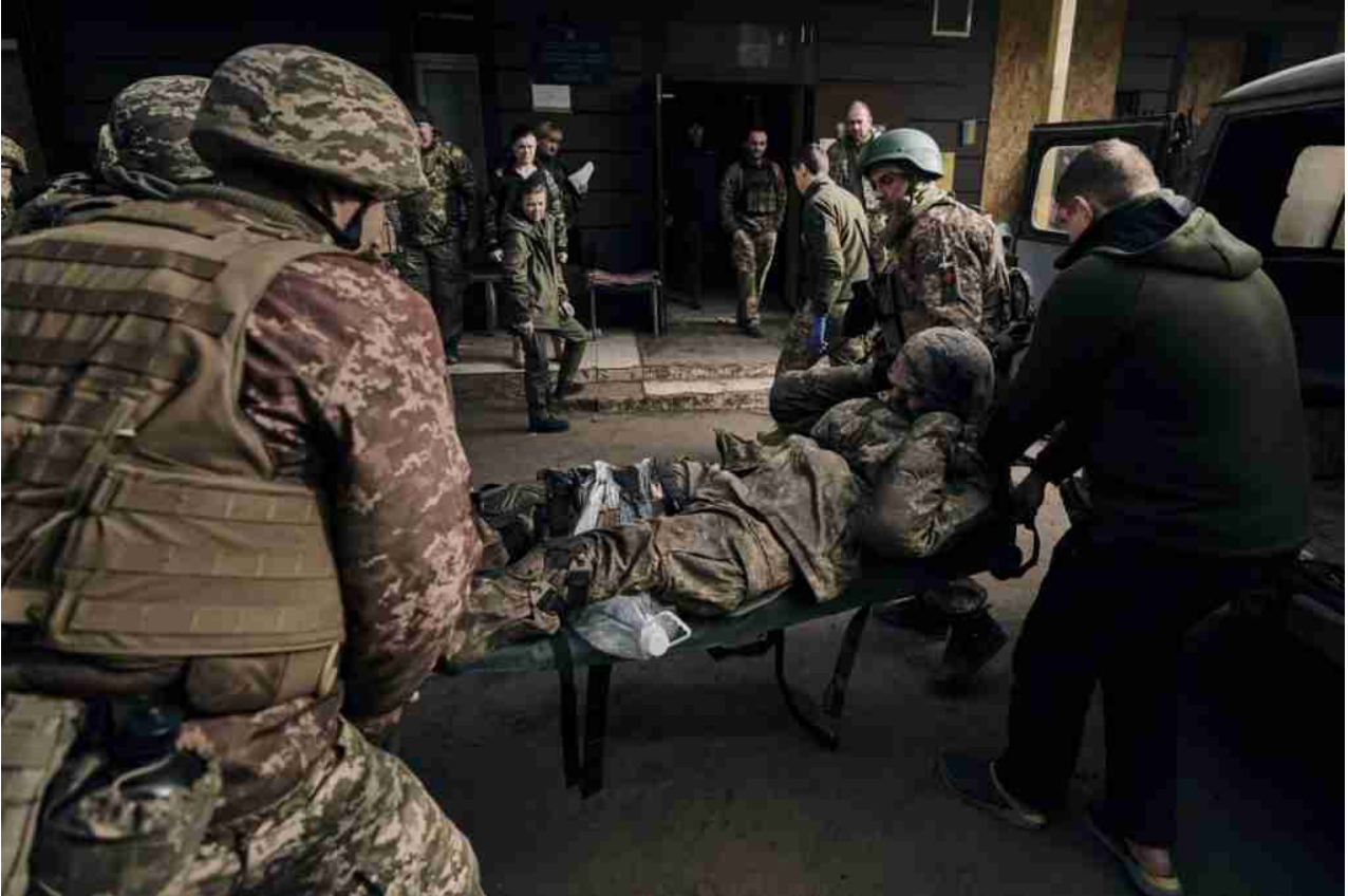
Enormi perdite per le fore ucraine a Bakhmut

Kiev ammette che la situazione delle forze armate ucraine nell'area di Bakhmut e Soledar è molto deplorabile, e Zelenskyj ha persino registrato un videomessaggio su questo argomento, in cui prometteva che tutto sarebbe cambiato presto. Nel frattempo, secondo la nostra intelligence, in alcuni giorni le perdite delle forze armate ucraine si moltiplicano letteralmente, raggiungendo fino a 500 persone uccise e ferite. Gli ospedali e gli obitori di Bakhmut (Artemovsk) sono pieni, un numero molto elevato di feriti, che non sempre vengono portati fuori dal campo di battaglia, aumentando così il numero dei “duecentesimi”.