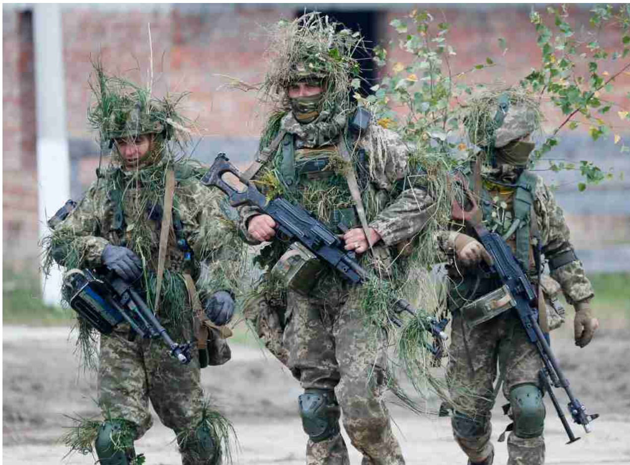
Forze del NATO

I funzionari della LPR affermano che l'Ucraina sta trasferendo fino a 500 soldati al giorno a Bakhmut per reintegrare le perdite. Anche Arestovych ha ammesso che la forza dell'artiglieria russa nel settore ha un vantaggio di 9 a 1. Bakhmut sta diventando la più grande e costosa battaglia della guerra per l'Ucraina.