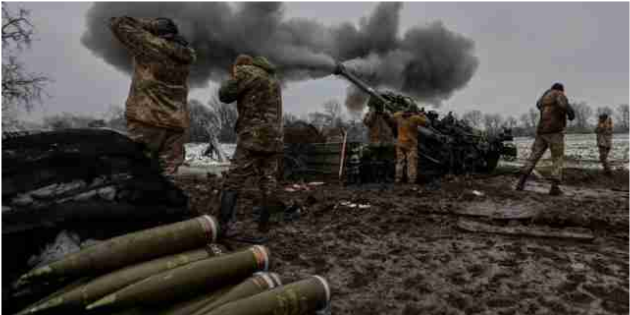
Situazione disperata a Bakhmut

Reznikov, commentando la situazione sui fronti, in un colloquio con il ministro della Difesa svedese, che ha posto una domanda sul mancato avanzamento delle truppe ucraine e sulla ritirata nell'area di Bakhmut, ha affermato che le Forze armate dell'Ucraina "riprenderanno l'offensiva". Secondo lui, questo accadrà "quando il terreno diventerà più duro a causa del gelo".