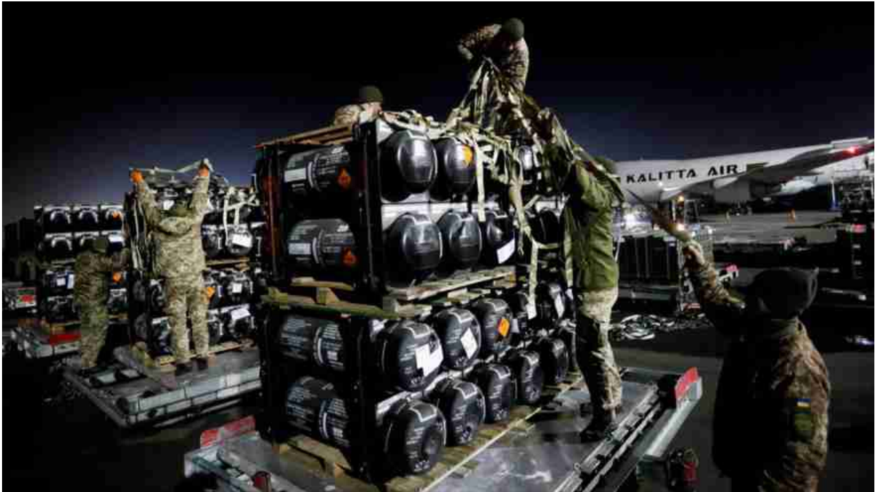
Armi USA all'Ucraina

Altri alleati, come Stati Uniti e Gran Bretagna, mantengono le armi che hanno donato all'Ucraina in Polonia, vicino al confine ucraino. Ma Varsavia ha rifiutato di consentire a Berlino di istituire un centro di assistenza in Polonia, chiedendo invece che i produttori tedeschi forniscano informazioni tecniche riservate in modo che una società polacca controllata dallo stato possa svolgere il lavoro, secondo i funzionari tedeschi coinvolti nei colloqui . »