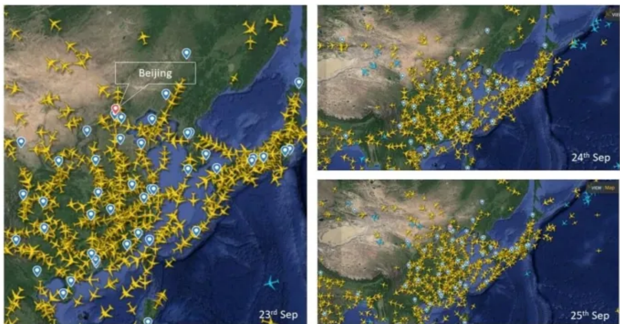
Chinese Airspace at 8 pm local time on the 23 rd , 24 th and 25 th of September; Source: (FlightRadar24)

Nella voce sono state menzionate anche massicce cancellazioni di voli aerei come segno che qualcosa non andava. Queste affermazioni si sono rivelate false .