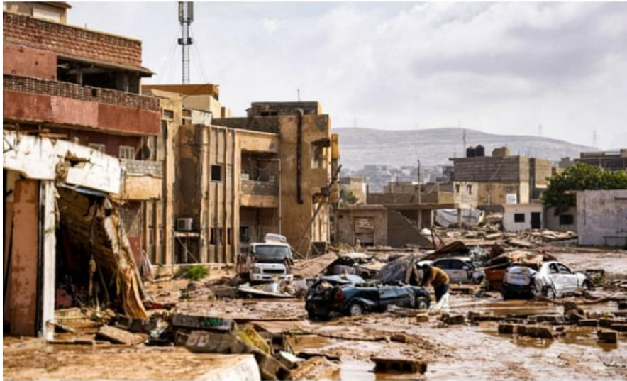
📷 Veicoli distrutti ed edifici danneggiati nella città orientale di Derna, a est di Bengasi.

Cittadini disperati lanciavano appelli sui social media per avere informazioni sui parenti scomparsi. Molti erano arrabbiati per la lentezza dei soccorsi e stavano iniziando le inchieste sugli avvertimenti dati in precedenza che le dighe di Wadi della città avevano bisogno di essere ricostruite.