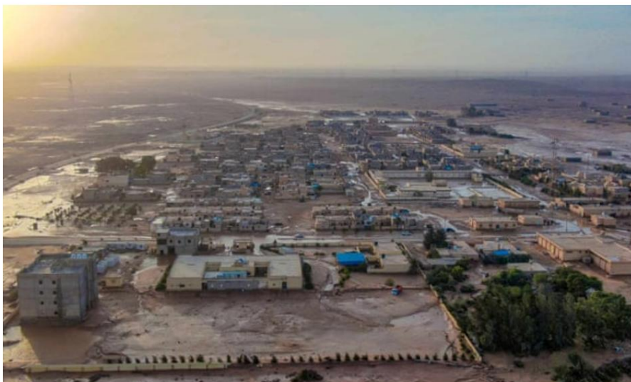
📷 Acqua dell'alluvione ad Al-Mukhaili.

L'inondazione causata dalla tempesta Daniel ha causato un'interruzione completa delle comunicazioni e l'interruzione dell'accesso a Internet a Derna. Interi quartieri sulla riva di un fiume in piena erano stati devastati e spazzati via.