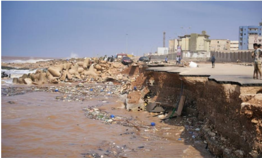
📷 Una strada costiera a Derna è crollata dopo una forte allagamento.

Un aereo di forniture mediche di emergenza che trasportava 14 tonnellate di rifornimenti, farmaci, attrezzature, sacchi per cadaveri e 87 membri del personale medico e paramedico era diretto a Bengasi per sostenere le zone colpite dall'alluvione, ha affermato il capo del governo di unità nazionale con sede a Tripoli, Abdul Hamid. Dbeibeh, ha detto martedì.