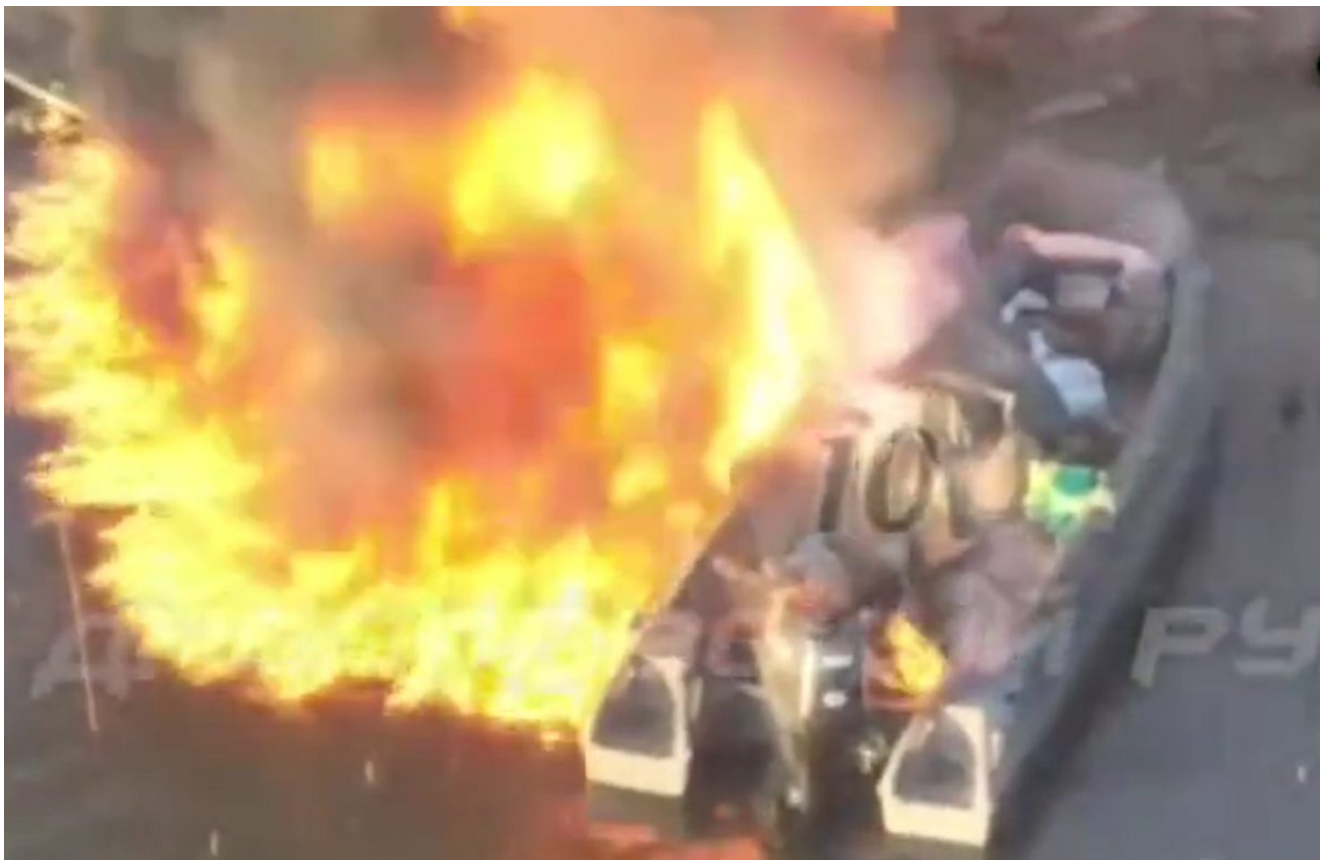
Barche ucraine colpite sul Dnieper