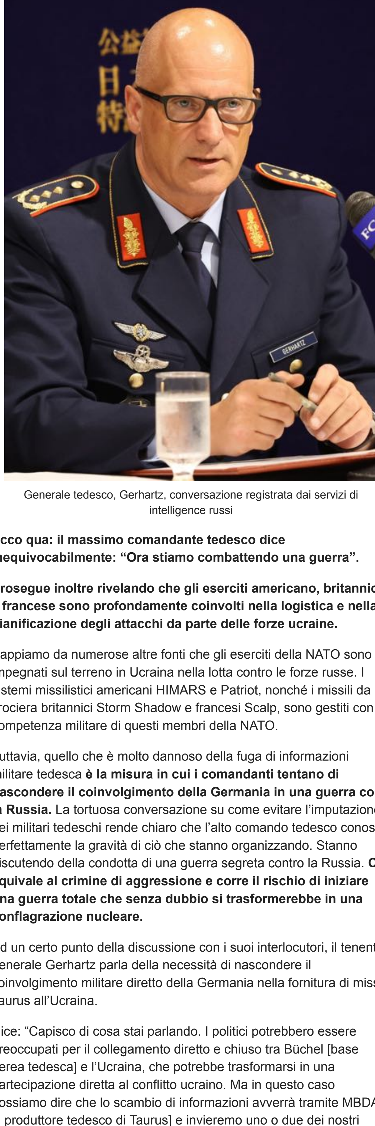
Generale tedesco, Gerhartz, conversazione registrata dai servizi di intelligence russi

Gerhartz, il capo dell'aeronautica tedesca, dice ai suoi subordinati senza mezzi termini: “Stiamo combattendo una guerra che utilizza una tecnologia molto più moderna della nostra buona vecchia Luftwaffe”.