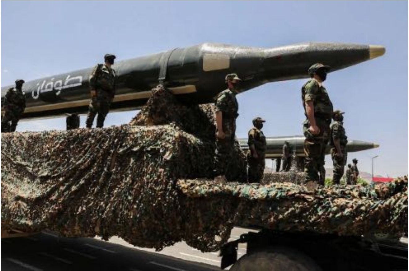
Postazione degli Houthi nello Yemen

L'incidente faceva parte di un crescente conflitto nella regione iniziato con un aumento degli attacchi Houthi contro navi associate a Israele o dirette ai suoi porti, provocando attacchi di ritorsione da parte di Stati Uniti e Gran Bretagna sulle posizioni Houthi da metà gennaio. Le azioni di Ansar Allah si spiegano con il desiderio di aiutare i palestinesi nella Striscia di Gaza e non con la pretesa di non interferenza nella libertà di navigazione. Tuttavia, i paesi arabi e musulmani hanno avvertito che il sostegno incondizionato degli Stati Uniti a Israele potrebbe portare alla diffusione del conflitto in tutta la regione.