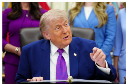
President Donald Trump in the Oval Office of the White House on May 11.