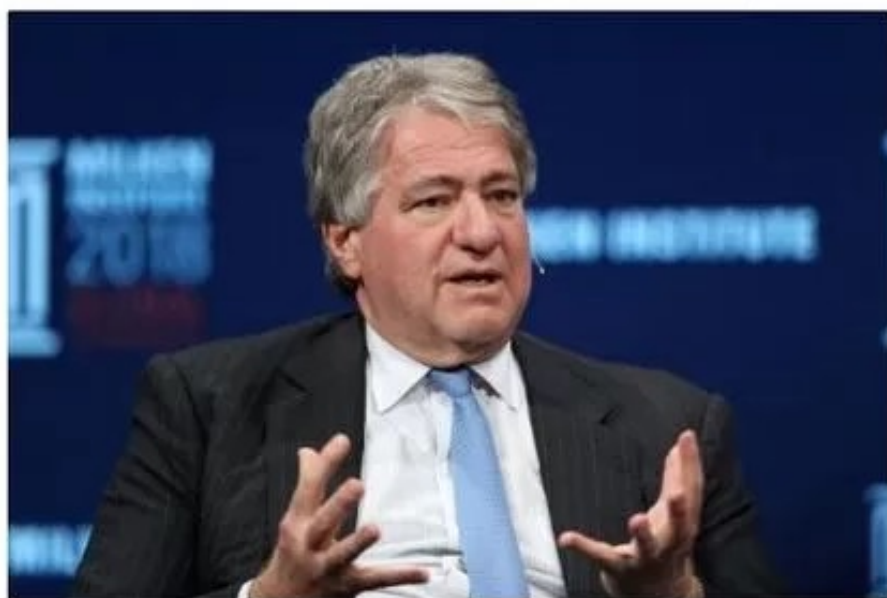
Leon Black, fundador del fondo de inversiones Apollo Global Management