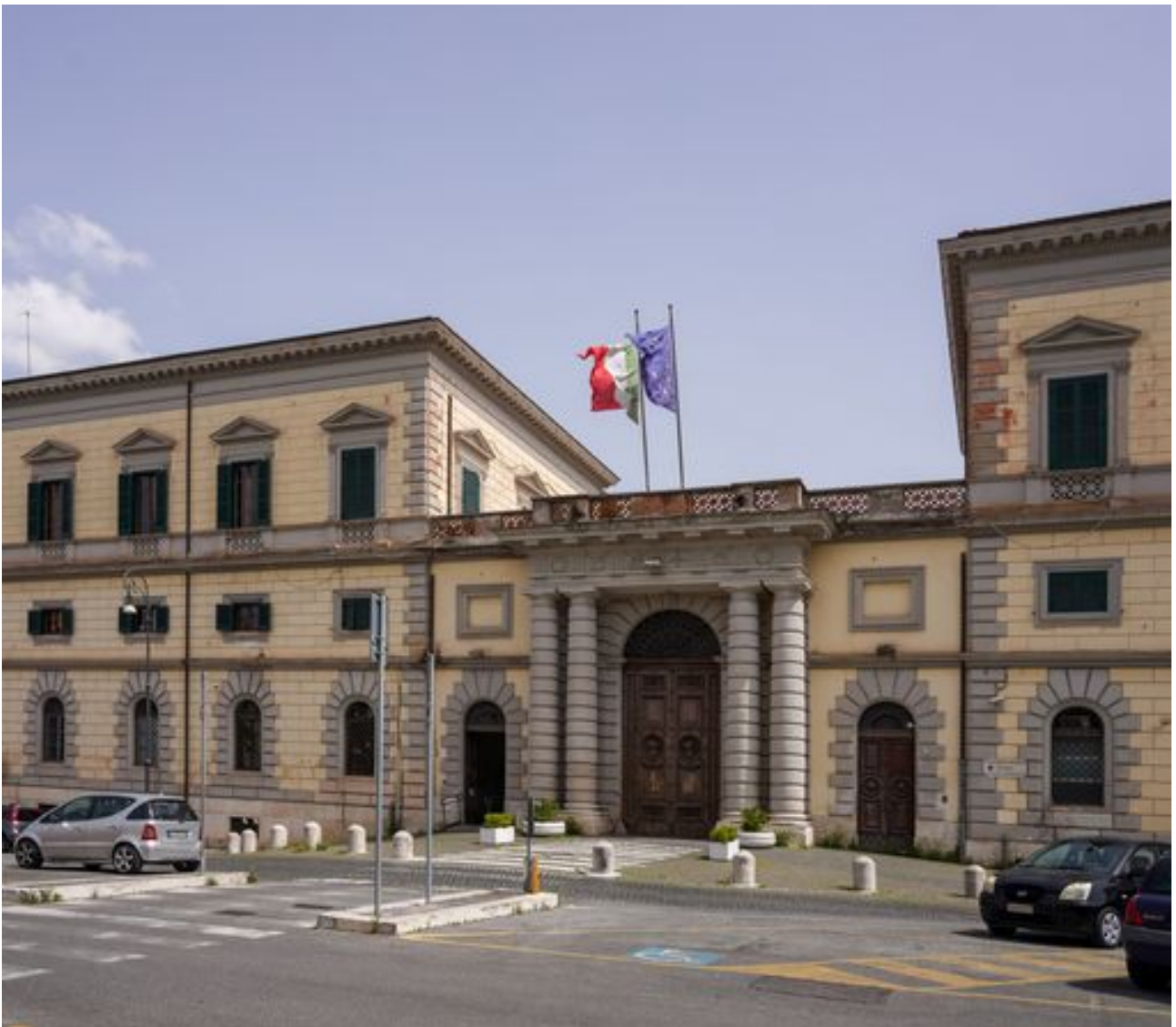
L'ospedale Celio a Roma

L'ex presidente del CEUM viveva in un appartamento non distante dal rione Celio, nel cuore di Roma, a due passi dal Colosseo, e nei pressi del policlinico militare.