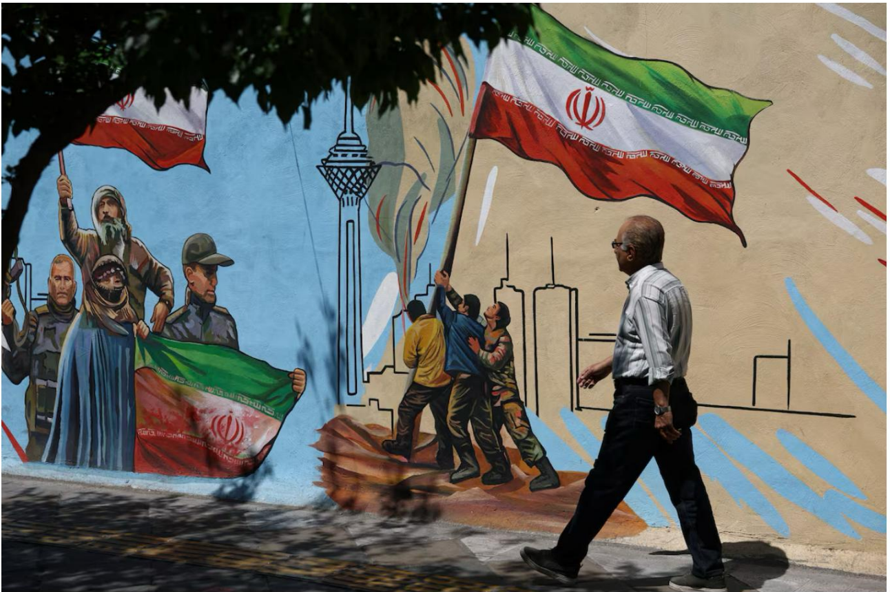
Un uomo iraniano cammina accanto a un murale in una strada di Teheran, Iran, l'11 maggio 2026.