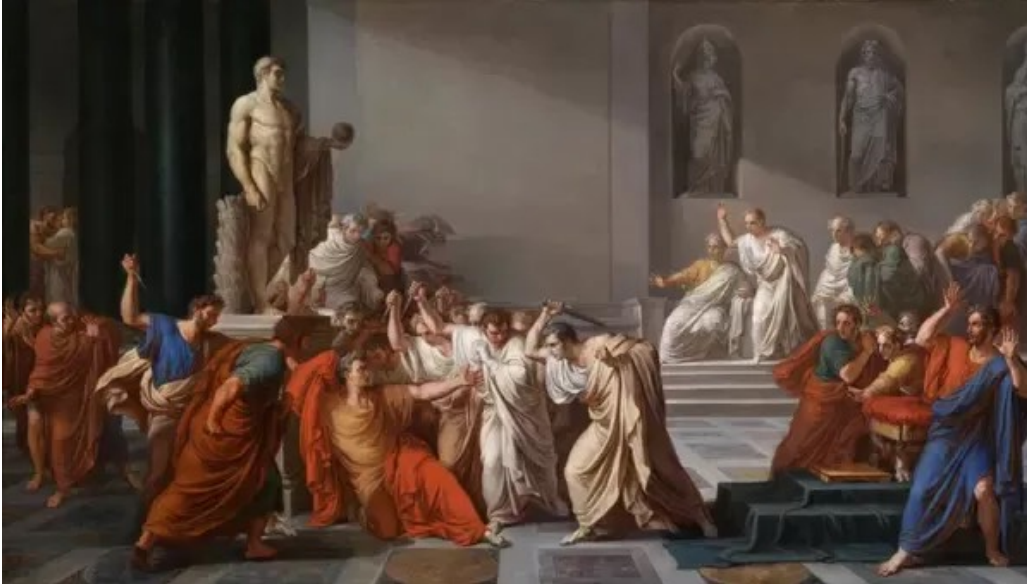
Fall of the Roman Empire in painting: Vincenzo Camuccini, La morte di Cesare, 1804-1805, Galleria Nazionale d'Arte

con qualcosa di più simile alla monarchia. Vance prosegue affermando che le università devono essere attaccate in modo onesto e aggressivo. E poi Vance ha descritto l’America come un paese che si trova in un “tardo periodo repubblicano.”