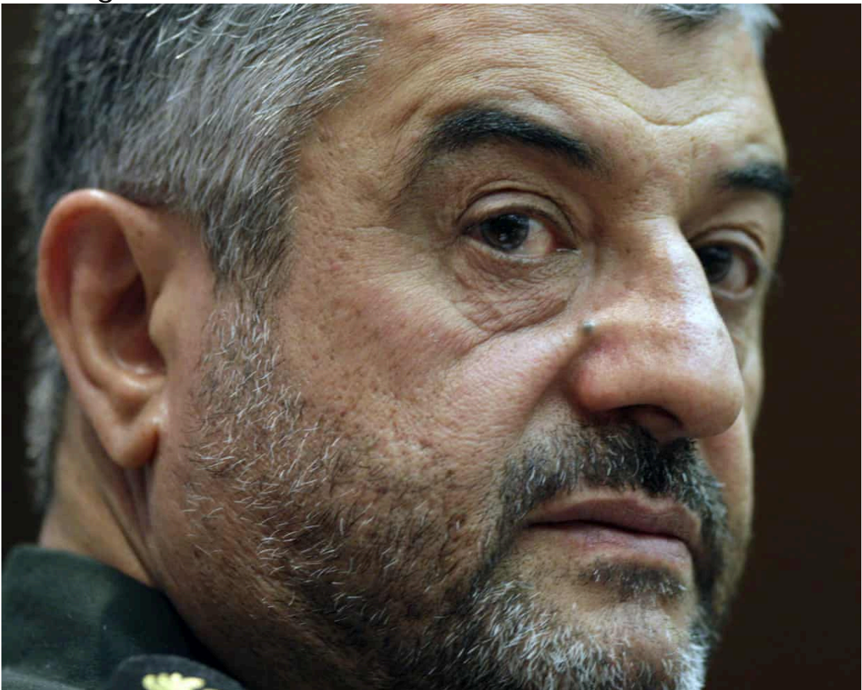
Il generale di divisione Mohammad Ali Jafari, ex comandante del Corpo delle Guardie Rivoluzionarie Islamiche.

Il generale di divisione Mohammad Ali Jafari, ex comandante del Corpo delle Guardie Rivoluzionarie Islamiche, ha dichiarato: "Finché la guerra su tutti i fronti non sarà finita, le sanzioni non saranno revocate, i fondi bloccati non saranno sbloccati, i danni di guerra non saranno risarciti e la sovranità dell'Iran sullo Stretto di Hormuz non sarà riconosciuta, non ci saranno altri negoziati".