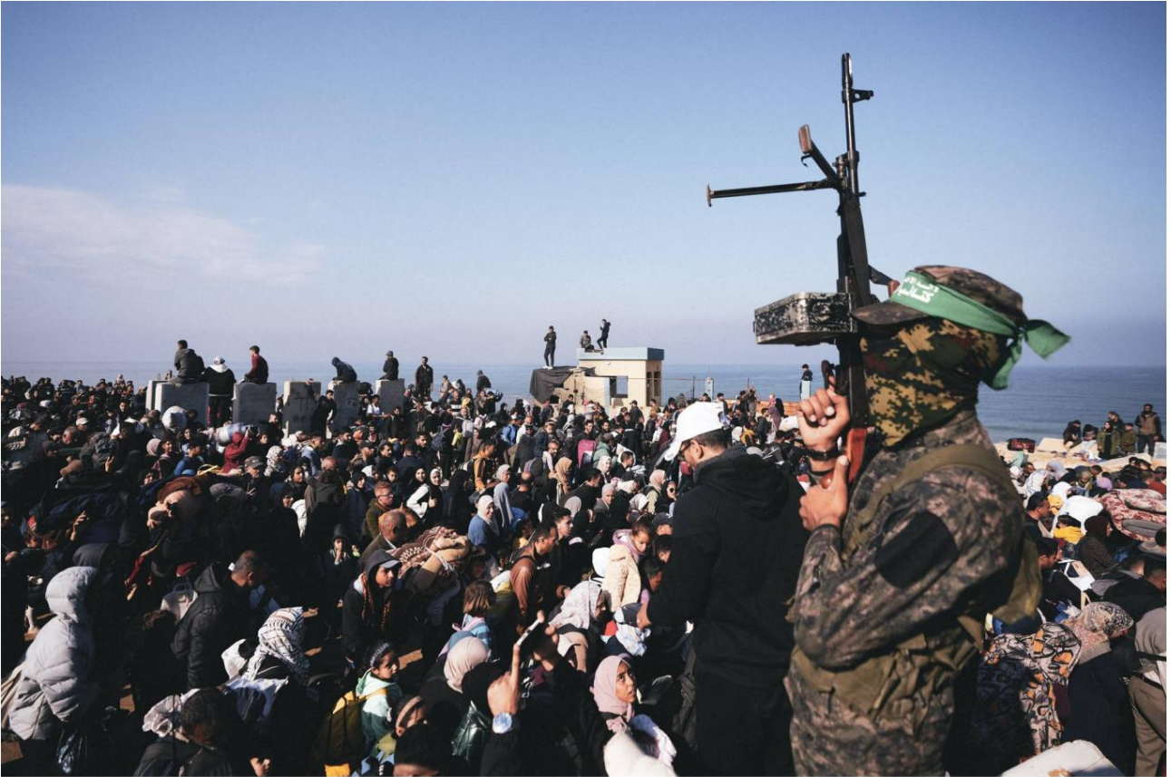
Un combattente di Hamas si trova vicino a dei palestinesi sfollati nel nord di Gaza, gennaio 27 maggio 2025.