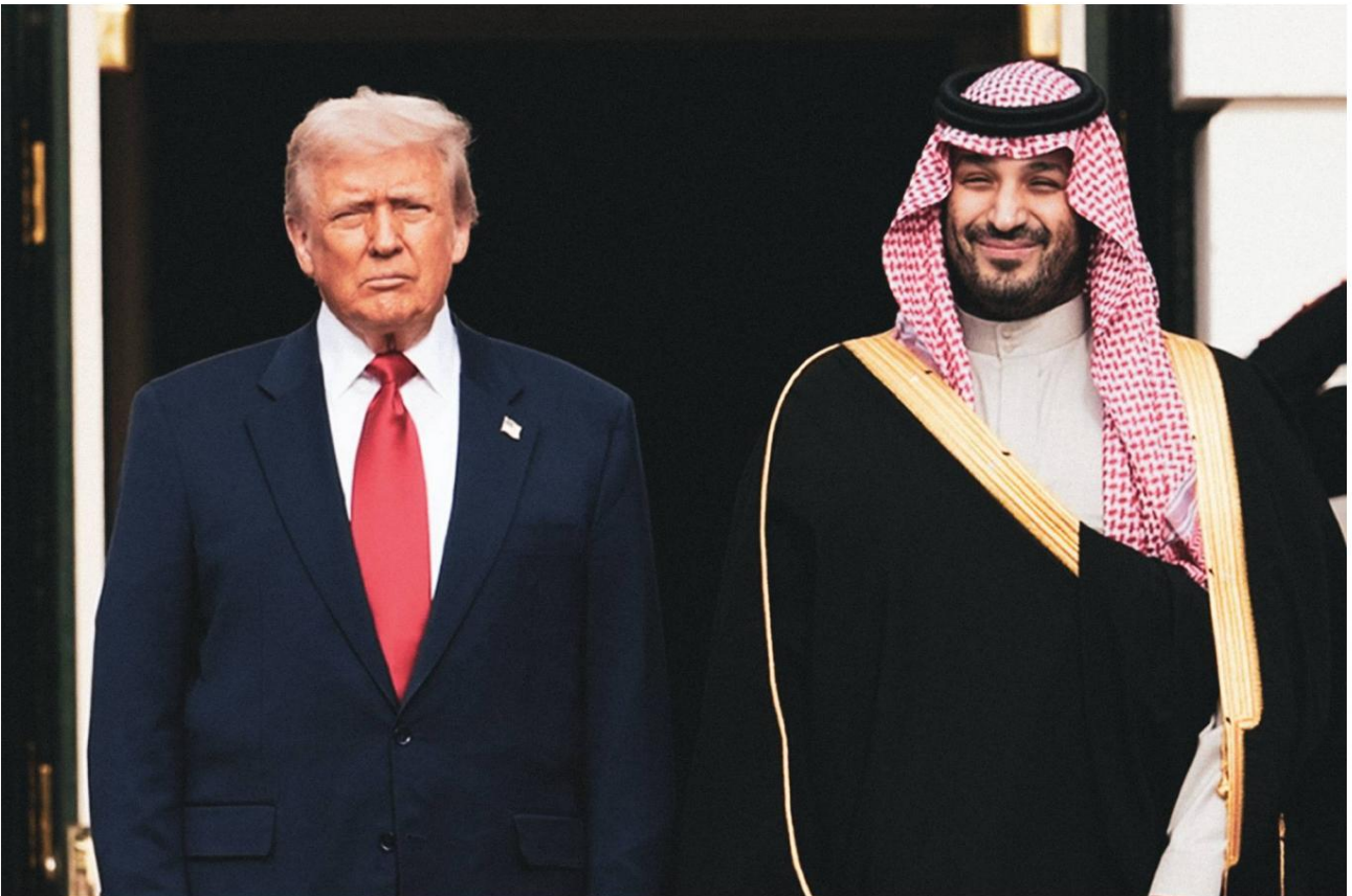
Il presidente Donald Trump con il principe ereditario saudita Mohammed bin Salman su La sua visita alla Casa Bianca, 18 novembre 2025.