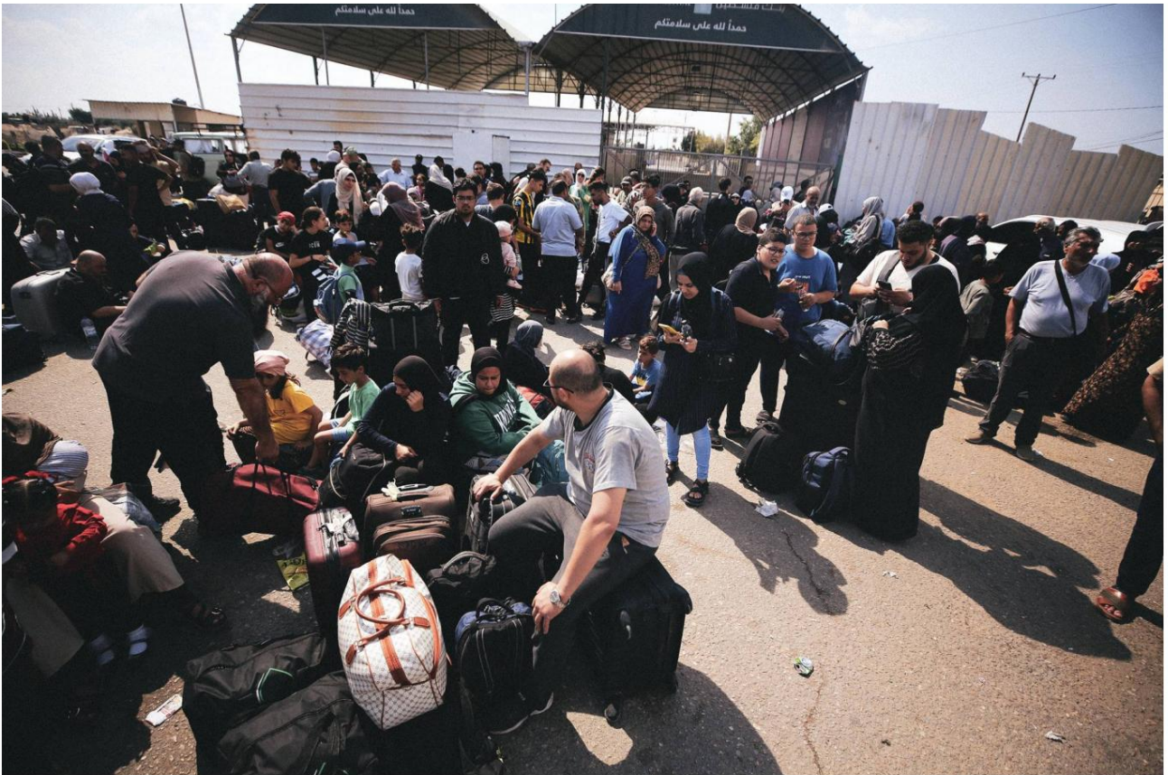
Palestinesi in attesa al valico di Rafah, Gaza, 16 ottobre 2023.