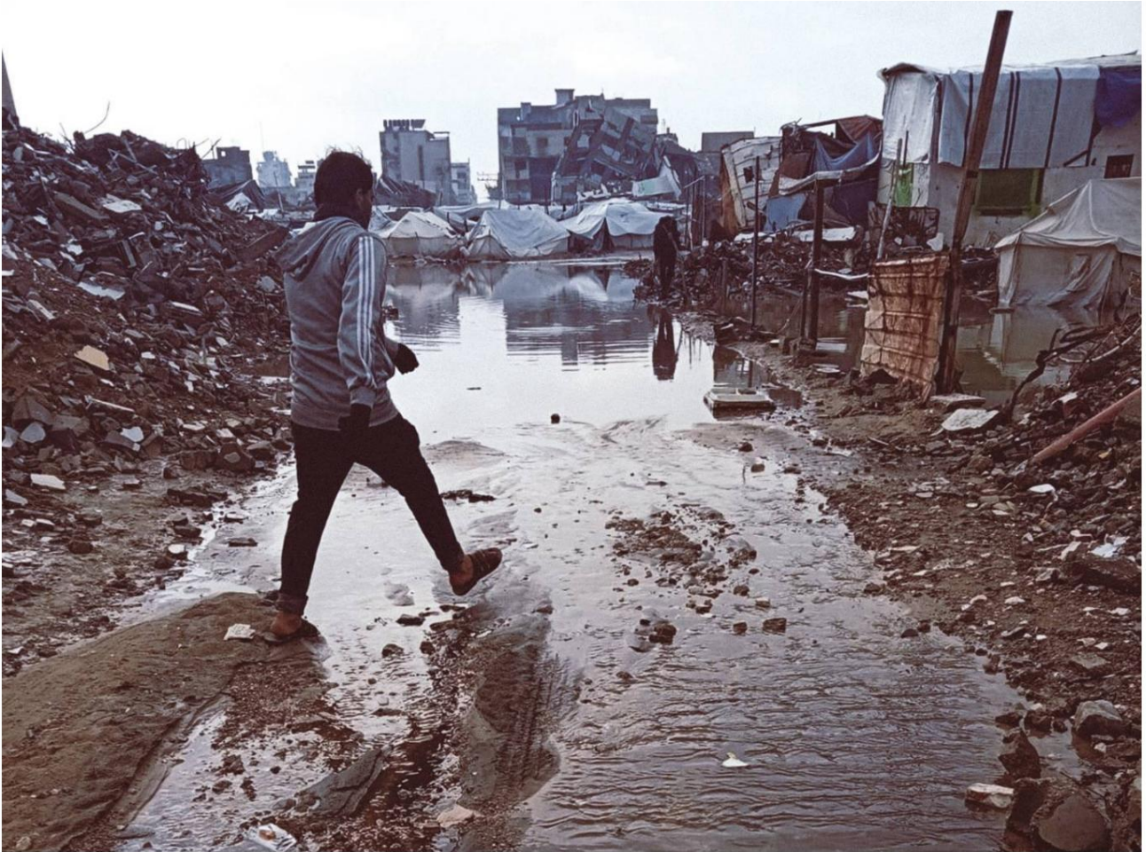
Tende allagate a Jabalia, Gaza, dicembre 2025.

* Per motivi di sicurezza, i nomi completi degli intervistati contrassegnati da un asterisco non vengono resi noti.