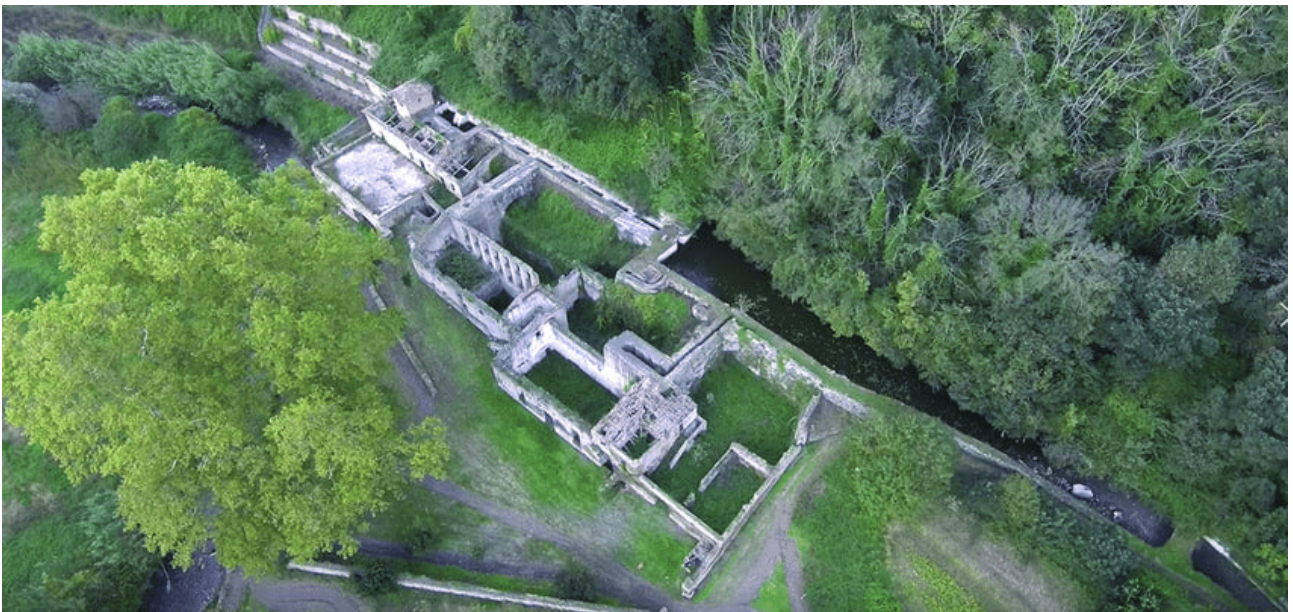
Veduta aerea del complesso del Mulino-Ferriera Alviggi, lungo il fiume Isclero (Sant'Agata de' Goti).

Dell'impianto di Sant'Agata de' Goti resta testimonianza nelle ricognizioni di Giuseppe Antuono (Università Federico II): «Risalendo il fiume Isclero, nella vegetazione si incontrano i frammenti, più o meno evidenti, di una passata organizzazione infrastrutturale, frutto delle molteplici relazioni del territorio con la provincia di Terra di Lavoro. Sono documentate numerose attività produttive sin dal XVII secolo... Il ricco patrimonio di architetture industriali si caratterizza per manufatti di forma, dimensione e localizzazione differenti: sei opifici che oggi è possibile rintracciare, in alcuni casi celati dalla fitta vegetazione, spesso abbandonati».