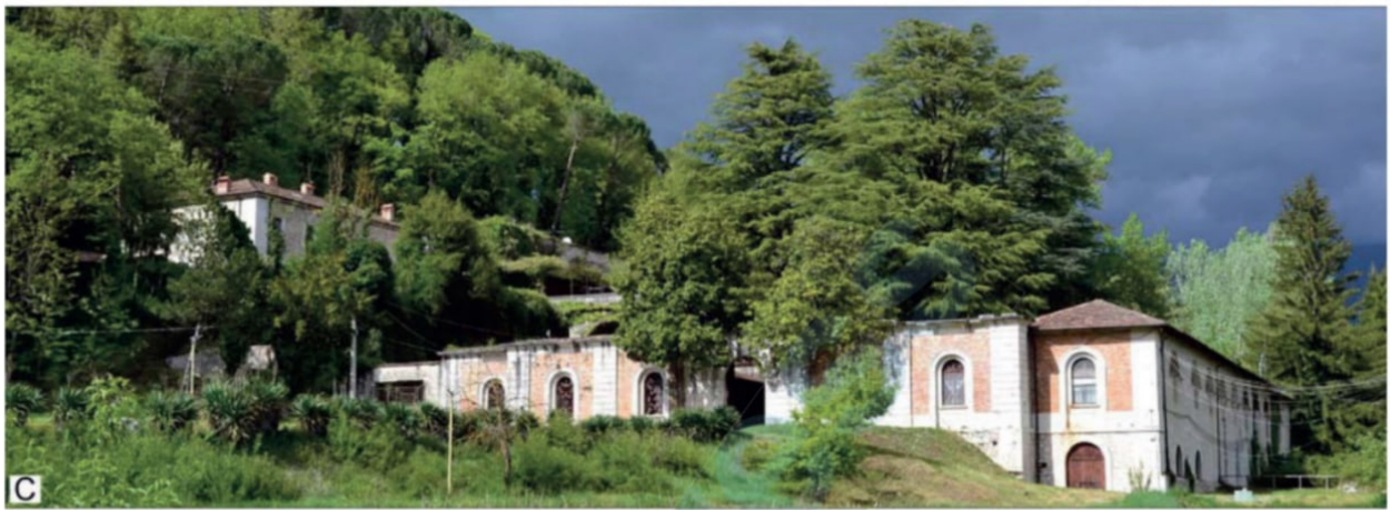
Ferriera di Atina (FR)

Dell'impianto di Sant'Agata de' Goti resta testimonianza nelle ricognizioni di Giuseppe Antuono (Università Federico II): «Risalendo il fiume Isclero, nella vegetazione si incontrano i frammenti, più o meno evidenti, di una passata organizzazione infrastrutturale, frutto delle molteplici relazioni del territorio con la provincia di Terra di Lavoro. Sono documentate numerose attività produttive sin dal XVII secolo... Il ricco patrimonio di architetture industriali si caratterizza per manufatti di forma, dimensione e localizzazione differenti: sei opifici che oggi è possibile rintracciare, in alcuni casi celati dalla fitta vegetazione, spesso abbandonati».