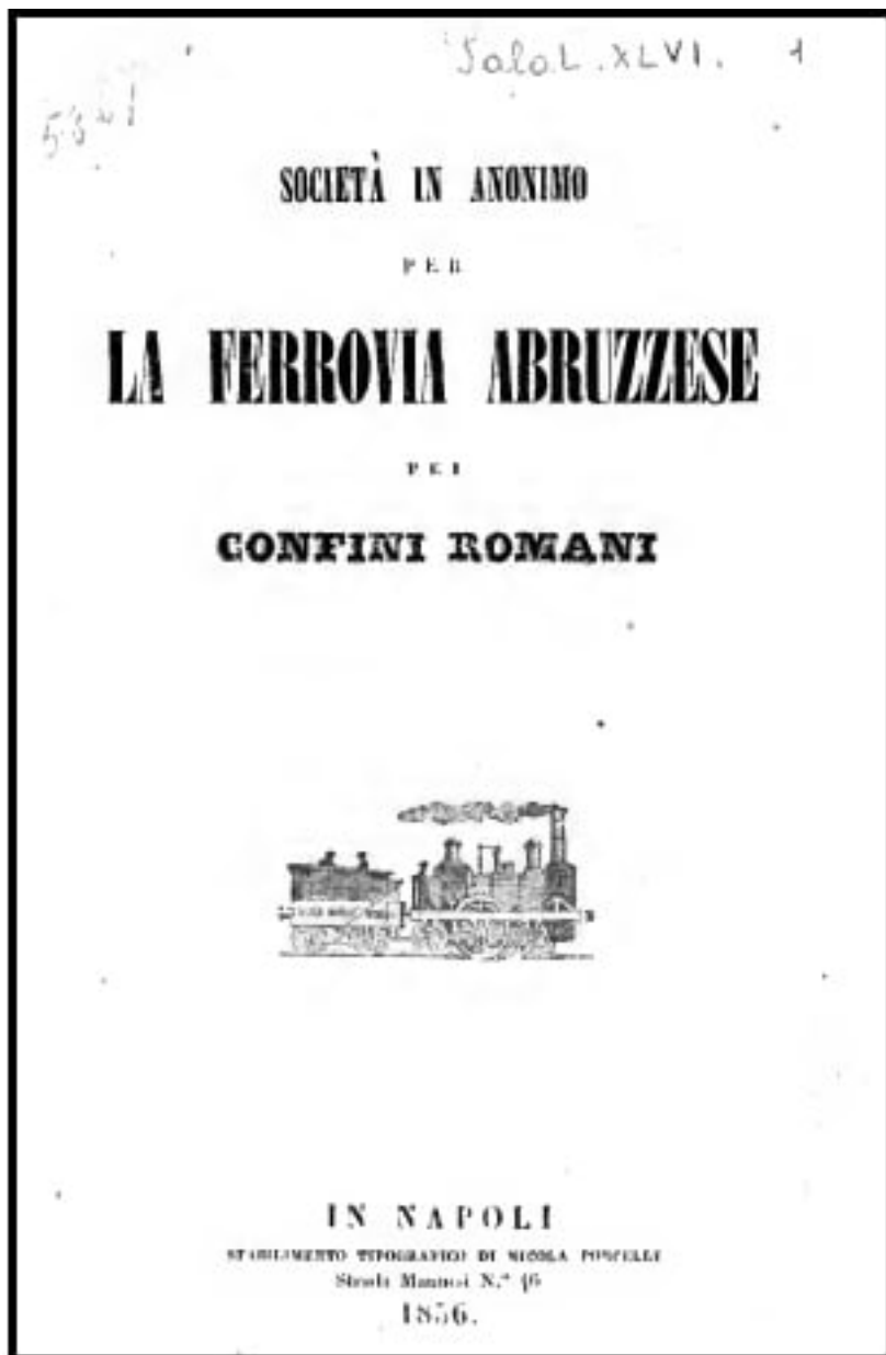
Frontespizio del prospetto della Società anonima per la Ferrovia Abruzzese «pei confini romani» (Napoli, 1856).