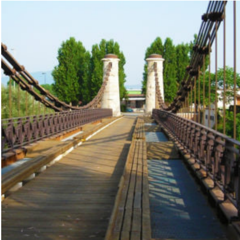
Il ponte sospeso in ferro sul Garigliano (Minturno), progettato dall'ingegnere Luigi Giura.

1839 e nel decennio precedente era entrato in servizio il primo piroscafo per la navigazione commerciale del Mediterraneo. I porti di Napoli, Palermo, Messina e di altri centri costieri favorivano il commercio e l'integrazione negli scambi mediterranei. Anche la rete di strade e ponti conobbe progressi significativi: ne è un esempio il ponte sospeso in ferro sul Garigliano, opera dell'ingegnere Luigi Giura.