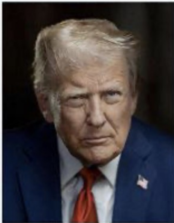
Official portrait, 2025