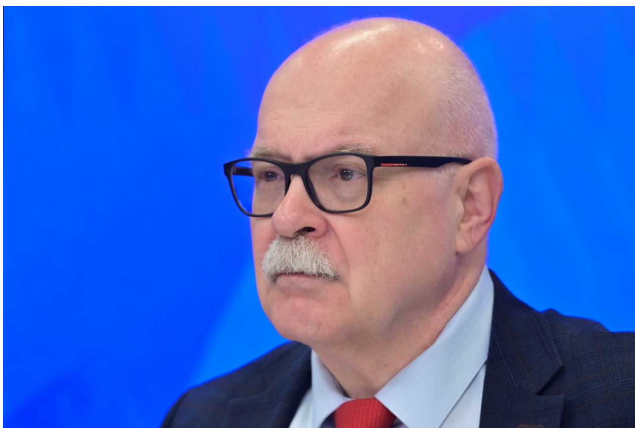
Dmitrij Trenin

paesi del Caucaso meridionale, del Kazakistan e dell'Asia centrale, invece di vivere semplicemente dei ricordi delle vacanze a Pitsunda o delle passeggiate nel Registan. Dobbiamo prendere la cosa sul serio, perché la nostra ignoranza o la nostra mancanza di comprensione dei nostri vicini creeranno problemi di cui non abbiamo assolutamente bisogno, proprio alle nostre porte. L'Ucraina dimostra quanto possa essere pericoloso un simile approccio.